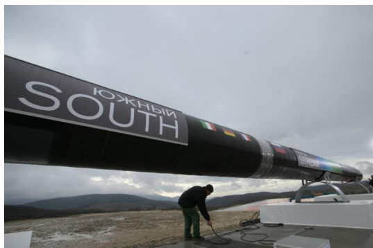
И после „Набука“ – „Набуко“

Сећате ли се како су медији и јавност у жеку евроентузијатске еуфорије у првој половини две хиљадитих година представљали „Набуко“, а како „Јужни ток“? „Набуко“ се представљао као „ коначно решење “ зависности Европе од увоза руских енергената, као брана руској експанзији у кавкаском региону и као својеврсни ексер у ковчегу руског „енергетског империјализма“. Поготово на Балкану, поготово у Србији, није било бољег примера незадрживог европског „ширења на исток“. Значај овог гасовода је до те мере пренаглашаван да се о њему често говорило као о разлогу због кога су Румунија и Бугарска експресно примљене у ЕУ (и што ће Турска бити „ускоро примљена“), док су нарочито ентузијастични заступници тезе о феноменалном значају овог пројекта ишли толико далеко да су га називали „разлогом бомбардовања Србије“ (јер наводно Косово лежи на некаквом фантомском „јужном краку“ овог гасовода ). Колико год спекулације о значају овог паневропског пројекта понекад бивале бесмислене и депласиране (уосталом, добар део српске јавности није никада научио да прави разлику између гасовода и нафтовода), без сумње су оне биле одјек несразмерно велике пажње коју су реализацији „Набука“ посвећивали чиновници ЕУ, а чији су сопствени ентузијастични испади често бивали ништа мање неоправдани и неутемељени.