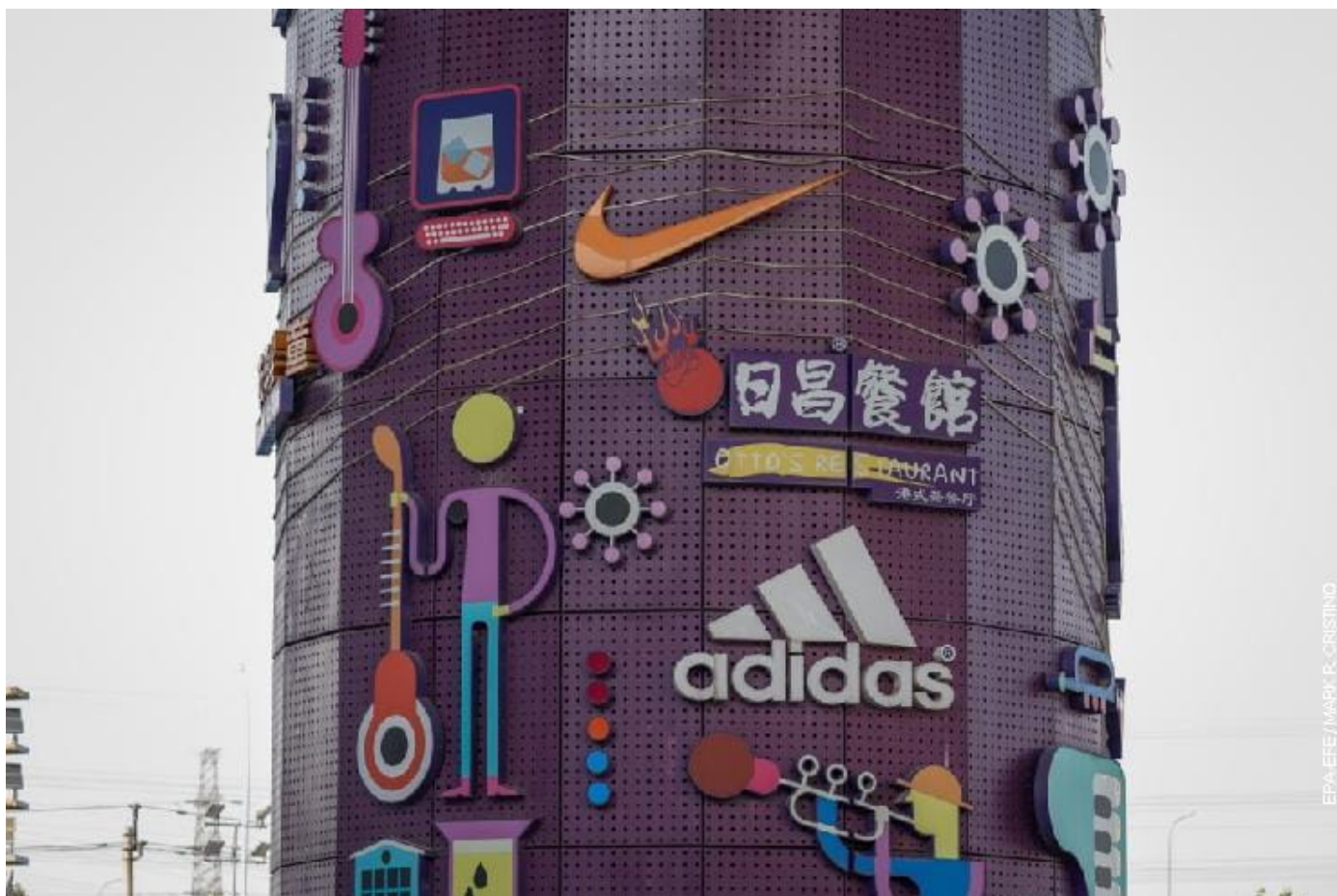
Тржни центар у Пекингу, Кина

Уместо да Вашингтон спроводи економску политику која има за циљ да промени режим у Пекингу, он би требало да активно управља економским односима са Кином на начин који могу развити интересе САД и одговорити на еволуирајуће геополитичке захтеве. Вашингтон већ смањује своје ослањање на Кину у главним ланцима снабдевања и покушава да одржи предност у осетљивим технологијама. Евентуални успех САД ће се мерити њиховом способношћу да задрже своје економско вођство, ојача савезе и избегне катастрофалне исходе.