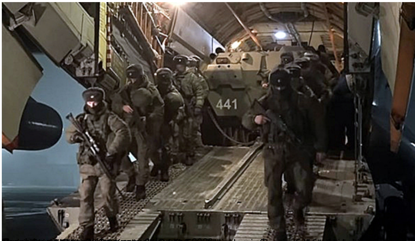
Солдати у тактичкој опреми слезу са авиона. У позадини је велики оклопни возила са бројем 441.

Пише: Драган Бисенић недеља, 09 јануар 2022 10:06