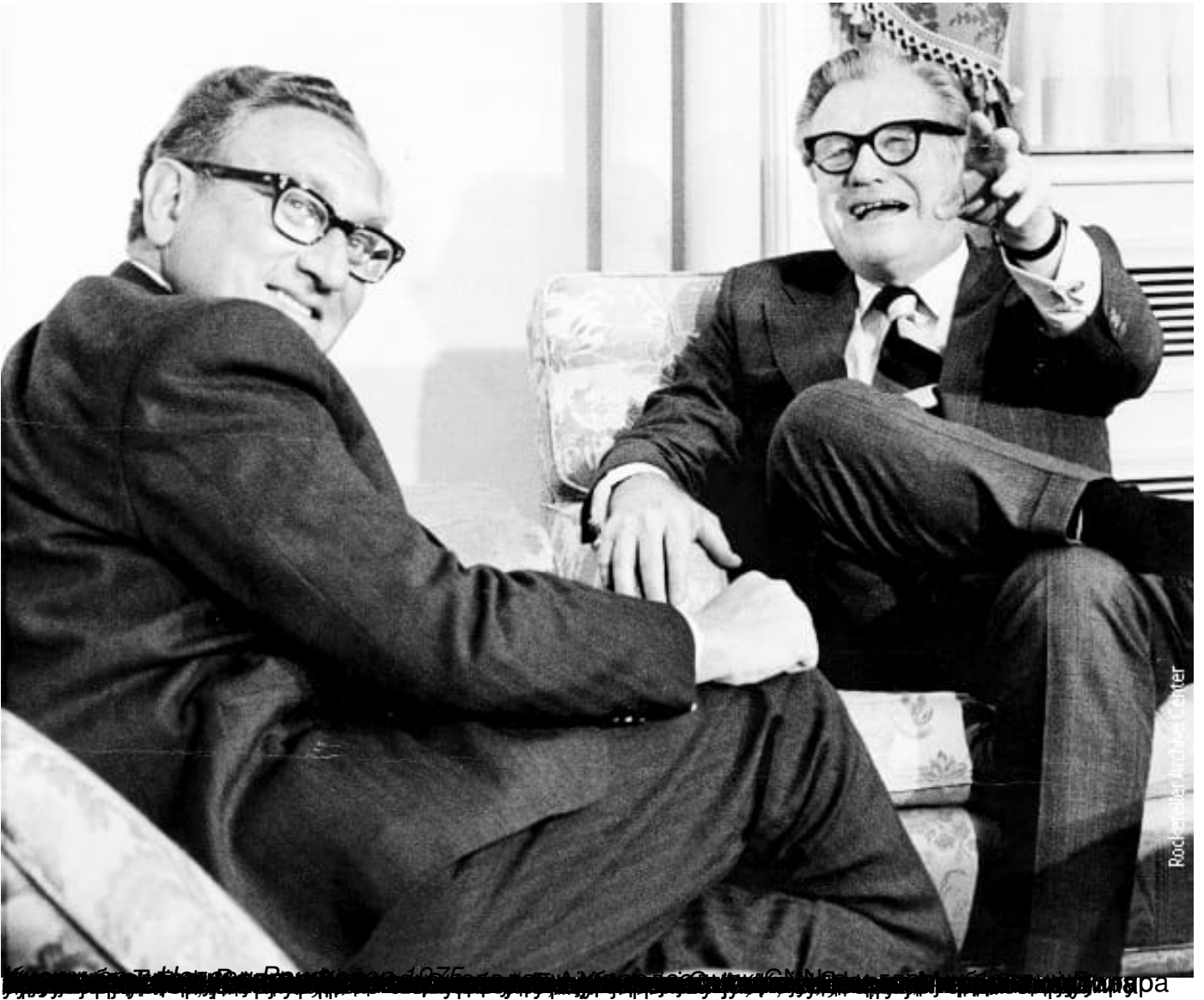
Хенри Кисинџер и Ричард Никсон, 1975.