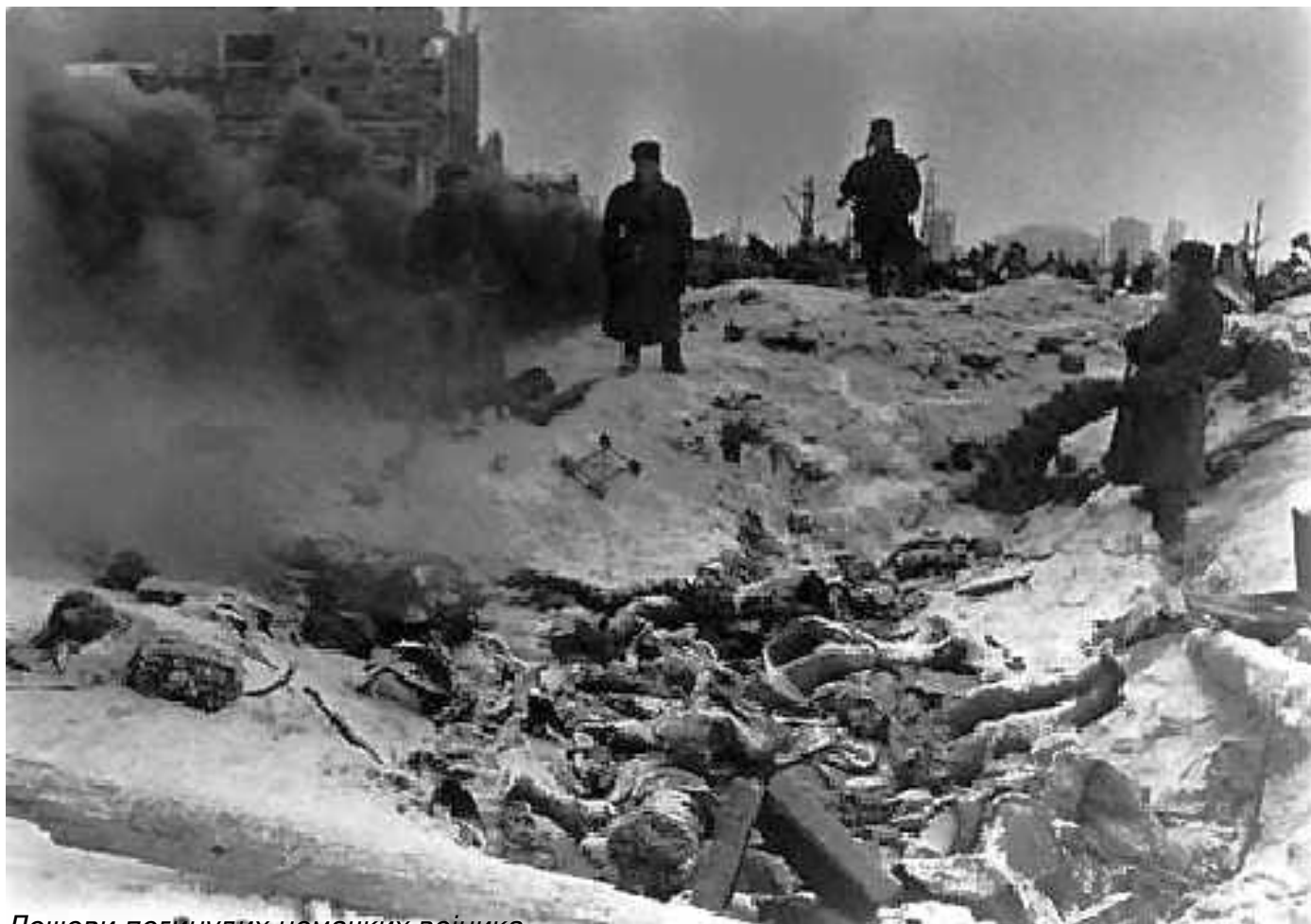
Лешеве погинулих немачких војника

Пише: Ђорђе Милошевић субота, 27 јануар 2024 09:00