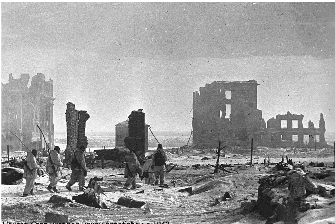
Нацист Стал ингерва црком ослобођен а 1942