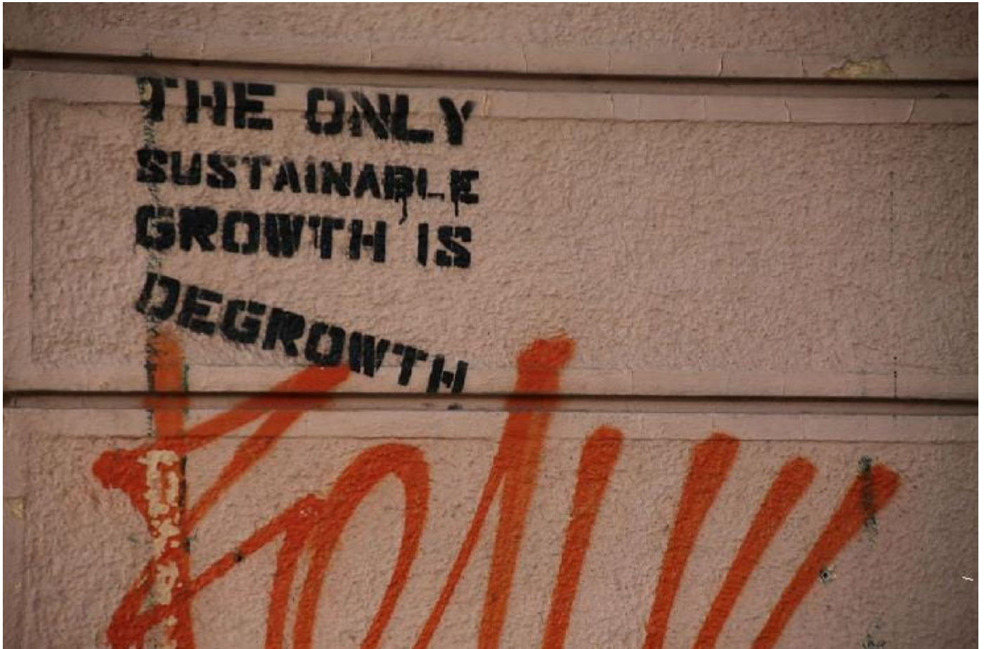
Графити Покрета "Degrowth"

Покрет „Degrowth“ или „НЕ-раст“ представља немилосрдну критику догме економског раста, пре свега у односу на његове еколошке последице. Главна хипотеза је да је потребан напредак без раста, што захтева радикално другачији економски систем и начин живота.