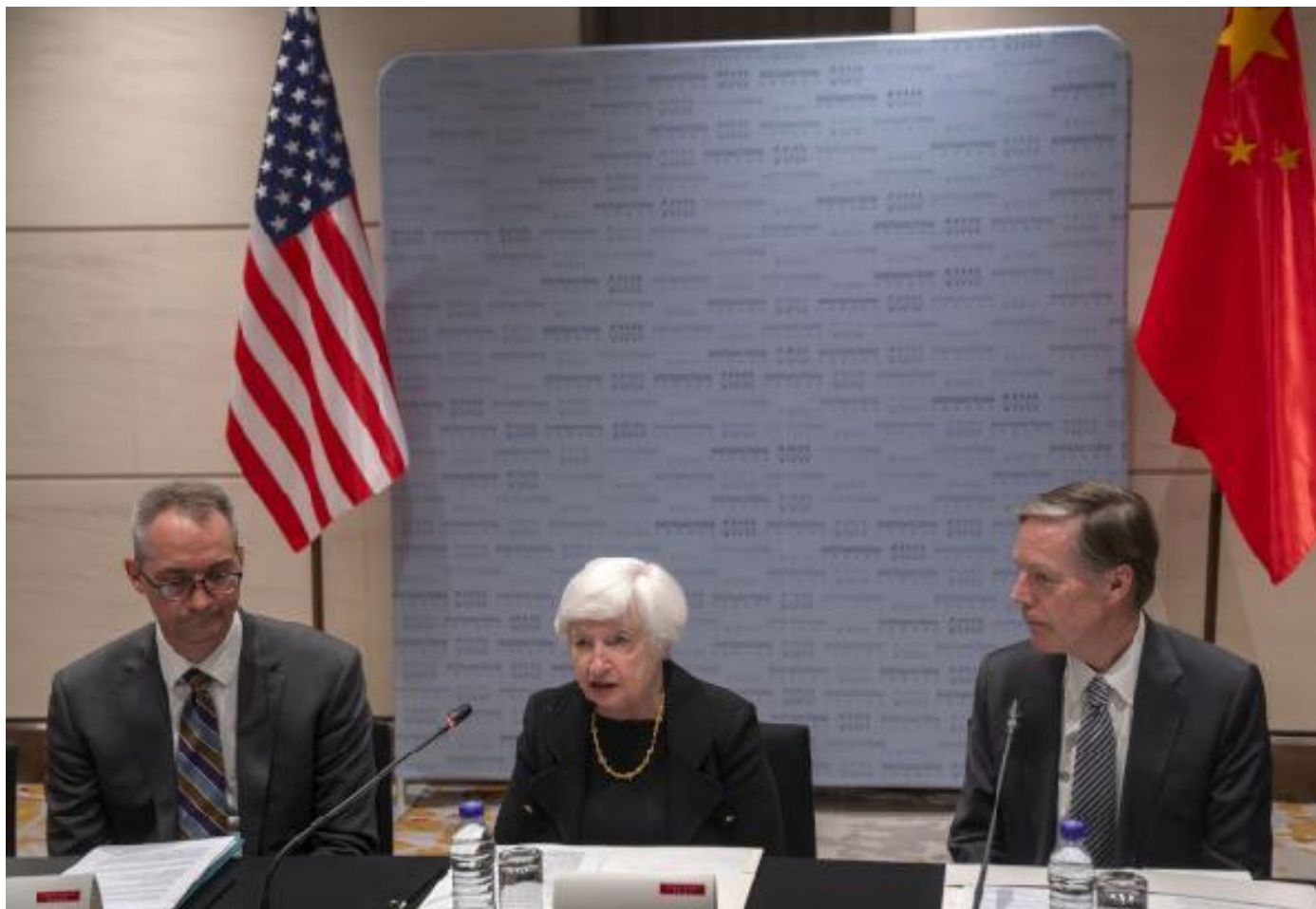
Министарка финансија САД Јелен у Пекингу

Но убрзо, у јулу, у Северну престоницу (што је буквално значење речи Беиђинг, односно, Пекинг) је пристигла министарка финансија Јелен, и онда, још интересантније, бивши државни секретар Кисинџер који се педесет година раније уписао у анале синоамеричких односа, када је испреговарао поновно успостављање прекинутих дипломатских веза између две земље и комунистичког дива приволео на блиску обавештајну сарадњу усмерену против Совјетског Савеза.