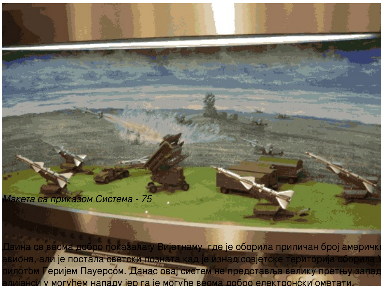
Макета са приказом Система - 75

СИСТЕМ С-75 Систем С-75 познатији као Двина или, по НАТО класификацији, SA-2 представља прилично застарели совјетски систем, намењен уништавању великих циљева слабих маневарских способности типа бомбардера на већим удаљеностима и висинама. Домет његове ракете је до 45 километара, али је због застарелости и пуњења ракете на течном гориву повучен из већине земаља које су га поседовале.