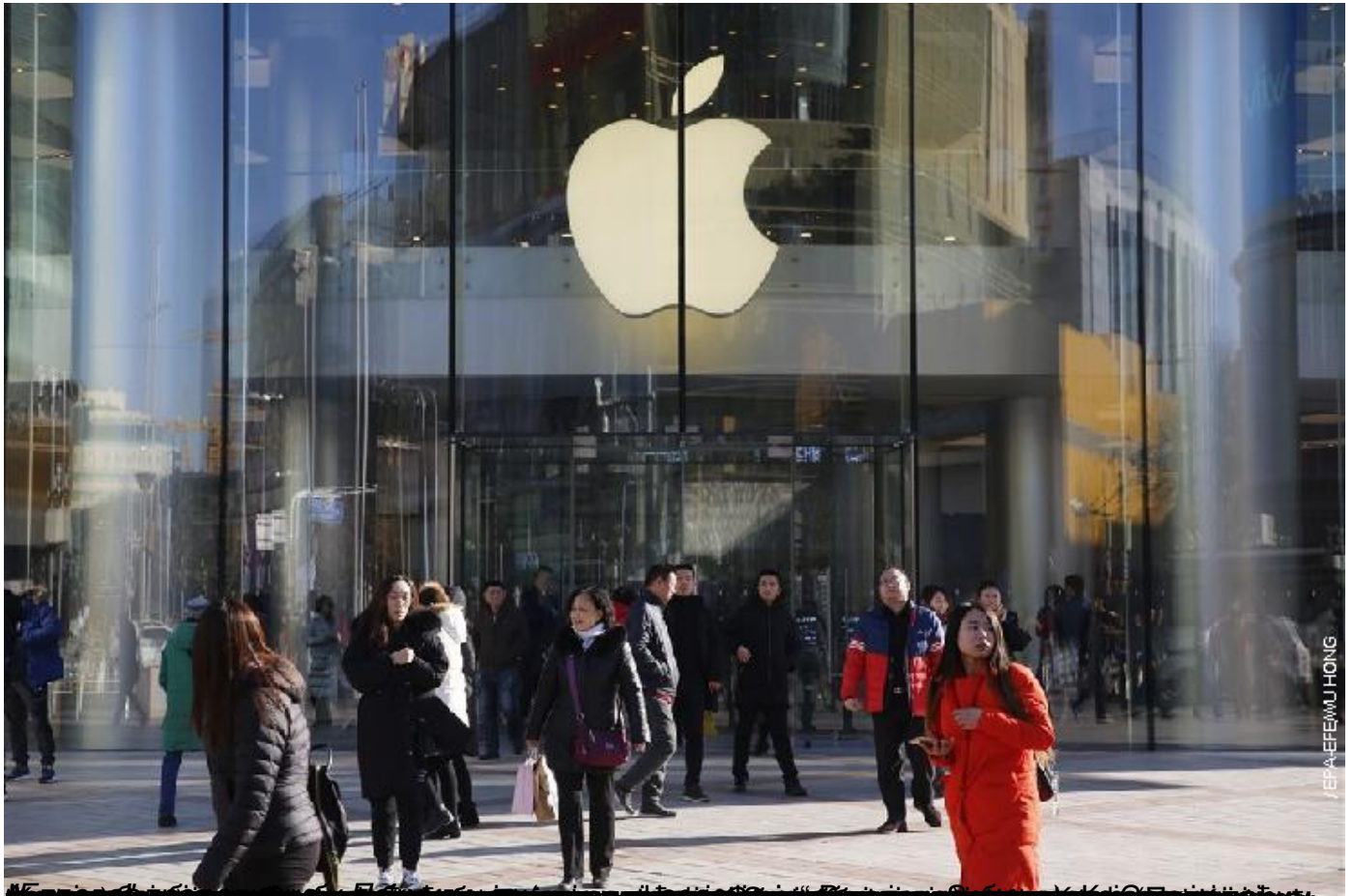
Foreign direct investment sharply

Пише: Горан Николић уторак, 16 мај 2023 08:15