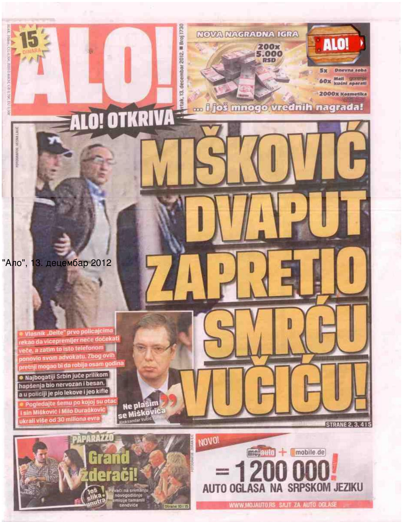
"Ало", 13. децембар 2012