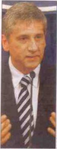
EKSKLUZIVNO: Vicekancelar Austrije Mihael Špindeleger

"Danas", 13. децембар 2012 Datum do juna