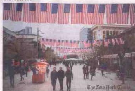
American flags streamer recently above the main street of Pristina, Kosovo capital. One of the world's oldest democracies Kosovo depended from Serbia, with the support of the United States. Published December 11, 2012

Весли Кларк, који је као врховни заповедник снага НАТО-а командовао бомбардовањем „српског моћника Слободана Милошевића“, као и Марк Талерајде, који је био један од директора Националног савета за безбедност у Клинтоновој Белој кући.