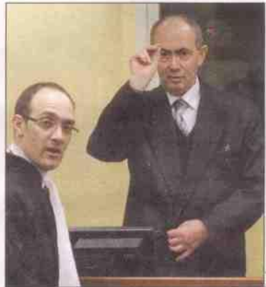
„Desna ruka, oči i uši“ Ratka Mladića, piše u presudi: Zdravko Tolimir

Prema presudi, masovna ubistva srebreničkih Muslimana