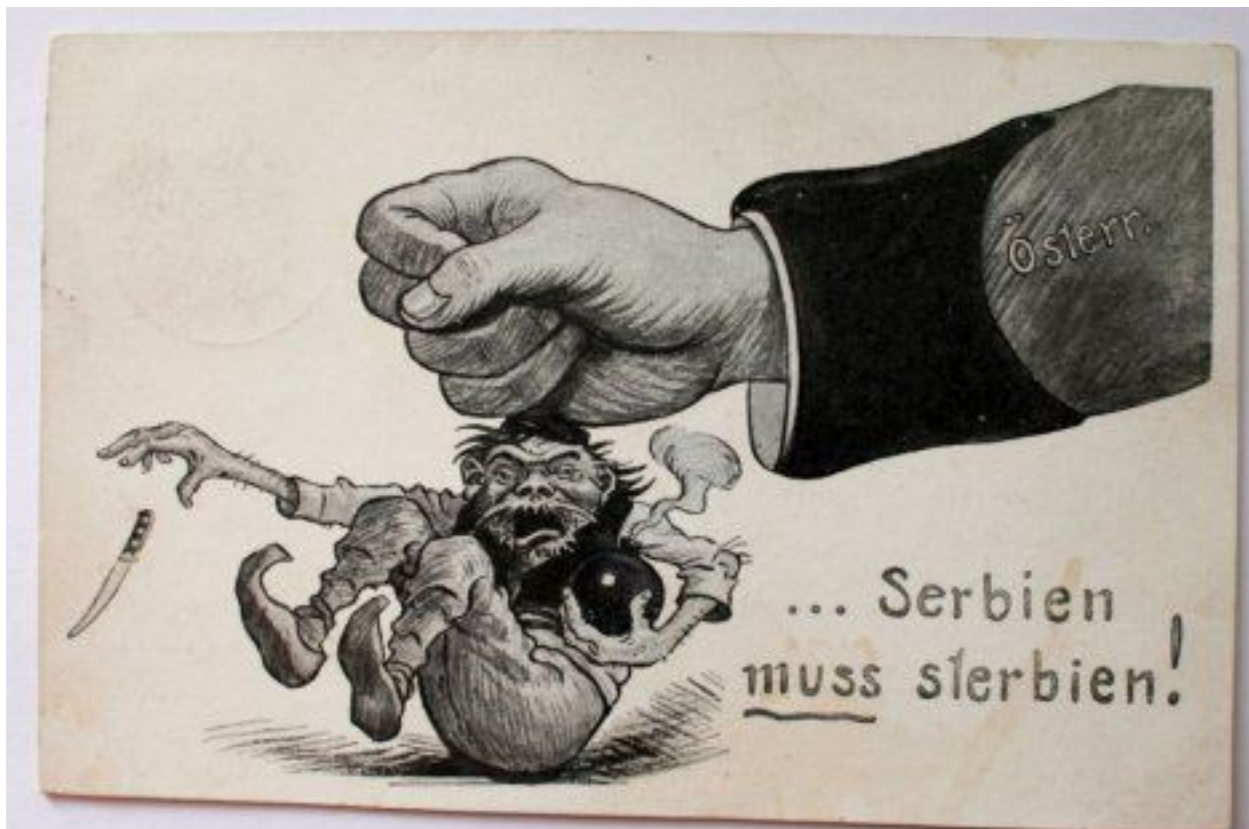
Слика из часописа "Der Kampf" из Београда, 1914. Србија је приказана као човек који држи бомбу и нож, док га велика рука Аустрије разбија. Текст испод гласи: "... Serbien muss sterben!"