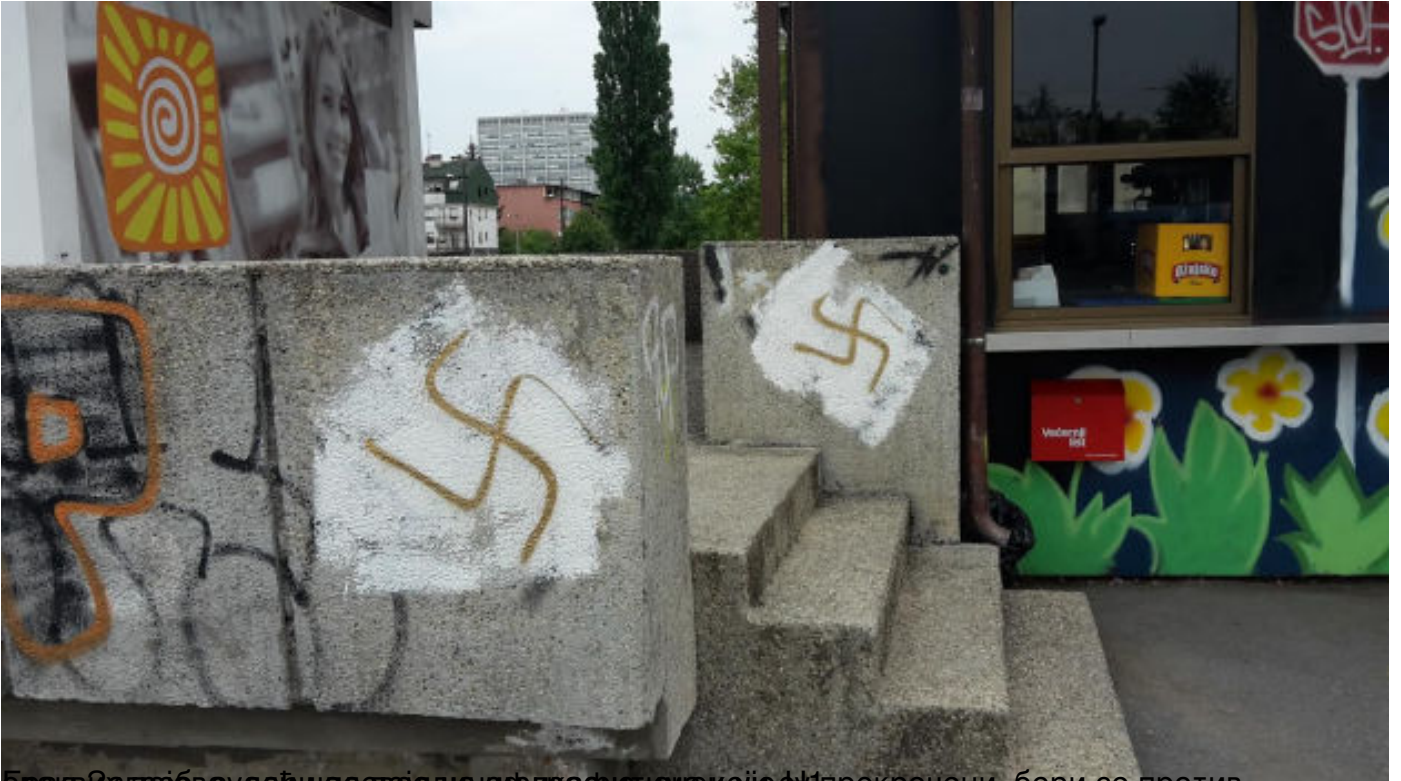
Брод у Загребу, а у даљини доводи до нафисафи, и да које су п...