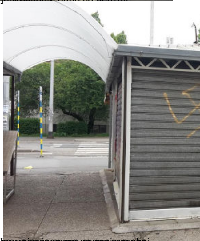
Брод у Загребу, а у даљини доводи до нафисафи, и да које су п...