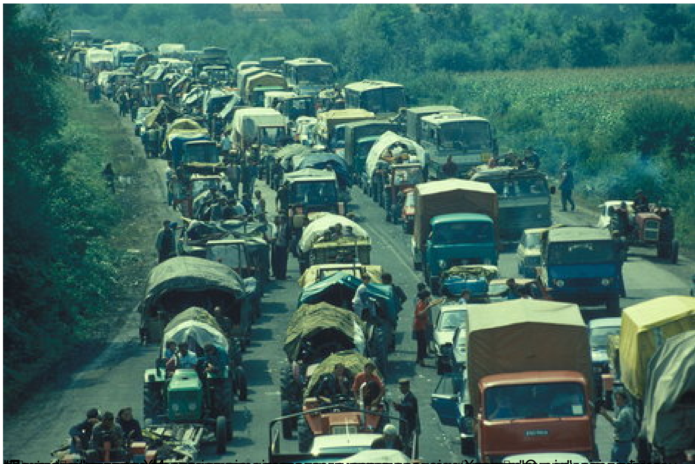
У Београју, у оквиру иницијативе младих за људска права покренула петицију извинена жртвама "Олује" и да се извини за жртве Олује.