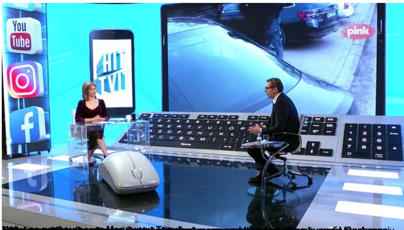
Недеља, 14. фебруар 2021. Београд. Милош Швајгер/Тв тријангл/Београдски медиј центар/Медија центар МУП-а. Слика у поруци је из МТИД. Слика је из МТИД.