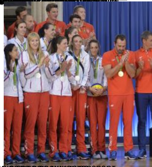
Београд, Србија | Олимпијски центар | Освајачи медаља на ОИ у Рију су сада задужени за спорт