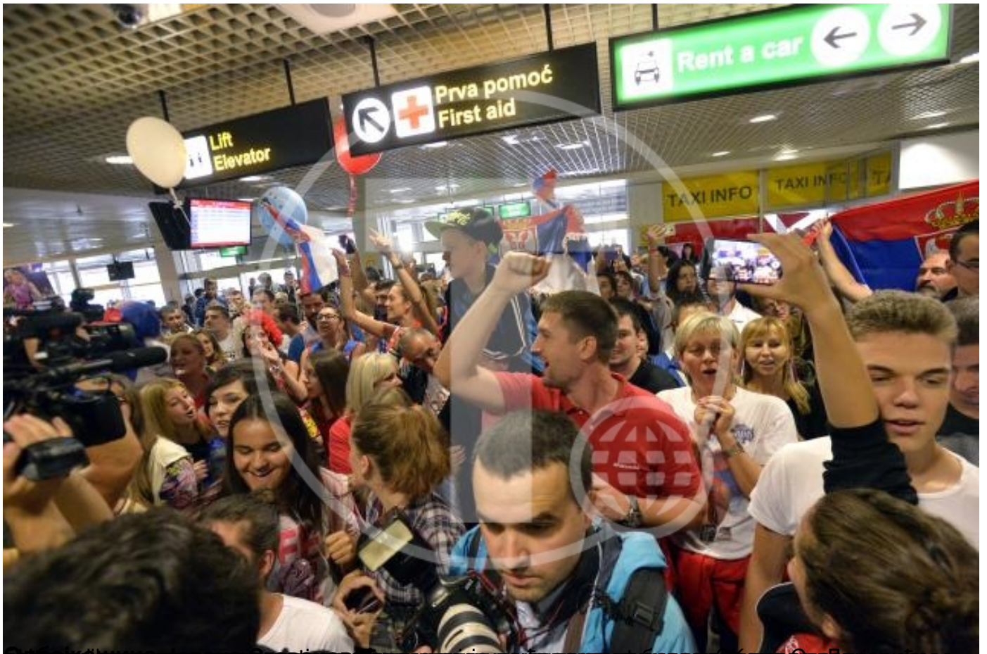
више десетина хиљада грађана на дочеку освајача медаља на ОИ у Рију у аеродрому у Београду