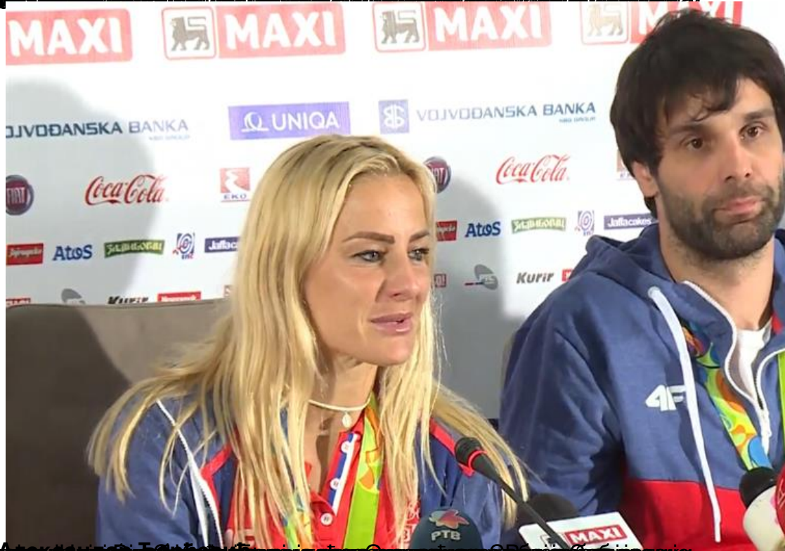
Српски кошаркашки репрезентативац на дочеку освајача медаља на ОИ у Рију