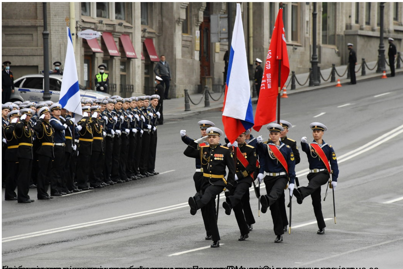
Билборд о првој војној паради у Москви поводом 75-годишнице победе над фашизмом у Др среда, 24 јун 2020 09:28