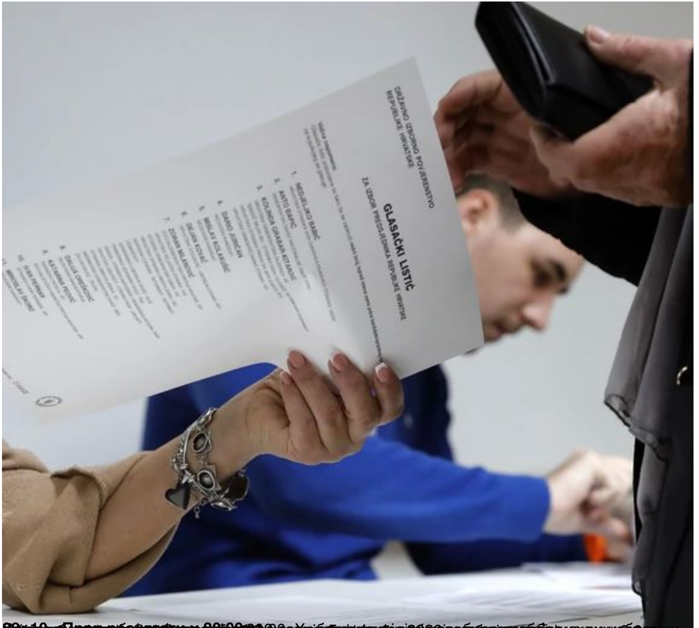
00:19:47 - 00:19:50 - 00:19:53 - 00:19:56 - 00:20:00 - 00:20:03 - 00:20:06 - 00:20:09 - 00:20:12 - 00:20:15 - 00:20:18 - 00:20:21 - 00:20:24 - 00:20:27 - 00:20:30 - 00:20:33 - 00:20:36 - 00:20:39 - 00:20:42 - 00:20:45 - 00:20:48 - 00:20:51 - 00:20:54 - 00:20:57 - 00:21:00 - 00:21:03 - 00:21:06 - 00:21:09 - 00:21:12 - 00:21:15 - 00:21:18 - 00:21:21 - 00:21:24 - 00:21:27 - 00:21:30 - 00:21:33 - 00:21:36 - 00:21:39 - 00:21:42 - 00:21:45 - 00:21:48 - 00:21:51 - 00:21:54 - 00:21:57 - 00:22:00 - 00:22:03 - 00:22:06 - 00:22:09 - 00:22:12 - 00:22:15 - 00:22:18 - 00:22:21 - 00:22:24 - 00:22:27 - 00:22:30 - 00:22:33 - 00:22:36 - 00:22:39 - 00:22:42 - 00:22:45 - 00:22:48 - 00:22:51 - 00:22:54 - 00:22:57 - 00:23:00 - 00:23:03 - 00:23:06 - 00:23:09 - 00:23:12 - 00:23:15 - 00:23:18 - 00:23:21 - 00:23:24 - 00:23:27 - 00:23:30 - 00:23:33 - 00:23:36 - 00:23:39 - 00:23:42 - 00:23:45 - 00:23:48 - 00:23:51 - 00:23:54 - 00:23:57 - 00:24:00 - 00:24:03 - 00:24:06 - 00:24:09 - 00:24:12 - 00:24:15 - 00:24:18 - 00:24:21 - 00:24:24 - 00:24:27 - 00:24:30 - 00:24:33 - 00:24:36 - 00:24:39 - 00:24:42 - 00:24:45 - 00:24:48 - 00:24:51 - 00:24:54 - 00:24:57 - 00:25:00 - 00:25:03 - 00:25:06 - 00:25:09 - 00:25:12 - 00:25:15 - 00:25:18 - 00:25:21 - 00:25:24 - 00:25:27 - 00:25:30 - 00:25:33 - 00:25:36 - 00:25:39 - 00:25:42 - 00:25:45 - 00:25:48 - 00:25:51 - 00:25:54 - 00:25:57 - 00:26:00 - 00:26:03 - 00:26:06 - 00:26:09 - 00:26:12 - 00:26:15 - 00:26:18 - 00:26:21 - 00:26:24 - 00:26:27 - 00:26:30 - 00:26:33 - 00:26:36 - 00:26:39 - 00:26:42 - 00:26:45 - 00:26:48 - 00:26:51 - 00:26:54 - 00:26:57 - 00:27:00 - 00:27:03 - 00:27:06 - 00:27:09 - 00:27:12 - 00:27:15 - 00:27:18 - 00:27:21 - 00:27:24 - 00:27:27 - 00:27:30 - 00:27:33 - 00:27:36 - 00:27:39 - 00:27:42 - 00:27:45 - 00:27:48 - 00:27:51 - 00:27:54 - 00:27:57 - 00:28:00 - 00:28:03 - 00:28:06 - 00:28:09 - 00:28:12 - 00:28:15 - 00:28:18 - 00:28:21 - 00:28:24 - 00:28:27 - 00:28:30 - 00:28:33 - 00:28:36 - 00:28:39 - 00:28:42 - 00:28:45 - 00:28:48 - 00:28:51 - 00:28:54 - 00:28:57 - 00:29:00 - 00:29:03 - 00:29:06 - 00:29:09 - 00:29:12 - 00:29:15 - 00:29:18 - 00:29:21 - 00:29:24 - 00:29:27 - 00:29:30 - 00:29:33 - 00:29:36 - 00:29:39 - 00:29:42 - 00:29:45 - 00:29:48 - 00:29:51 - 00:29:54 - 00:29:57 - 00:30:00 - 00:30:03 - 00:30:06 - 00:30:09 - 00:30:12 - 00:30:15 - 00:30:18 - 00:30:21 - 00:30:24 - 00:30:27 - 00:30:30 - 00:30:33 - 00:30:36 - 00:30:39 - 00:30:42 - 00:30:45 - 00:30:48 - 00:30:51 - 00:30:54 - 00:30:57 - 00:31:00 - 00:31:03 - 00:31:06 - 00:31:09 - 00:31:12 - 00:31:15 - 00:31:18 - 00:31:21 - 00:31:24 - 00:31:27 - 00:31:30 - 00:31:33 - 00:31:36 - 00:31:39 - 00:31:42 - 00:31:45 - 00:31:48 - 00:31:51 - 00:31:54 - 00:31:57 - 00:32:00 - 00:32:03 - 00:32:06 - 00:32:09 - 00:32:12 - 00:32:15 - 00:32:18 - 00:32:21 - 00:32:24 - 00:32:27 - 00:32:30 - 00:32:33 - 00:32:36 - 00:32:39 - 00:32:42 - 00:32:45 - 00:32:48 - 00:32:51 - 00:32:54 - 00:32:57 - 00:33:00 - 00:33:03 - 00:33:06 - 00:33:09 - 00:33:12 - 00:33:15 - 00:33:18 - 00:33:21 - 00:33:24 - 00:33:27 - 00:33:30 - 00:33:33 - 00:33:36 - 00:33:39 - 00:33:42 - 00:33:45 - 00:33:48 - 00:33:51 - 00:33:54 - 00:33:57 - 00:34:00 - 00:34:03 - 00:34:06 - 00:34:09 - 00:34:12 - 00:34:15 - 00:34:18 - 00:34:21 - 00:34:24 - 00:34:27 - 00:34:30 - 00:34:33 - 00:34:36 - 00:34:39 - 00:34:42 - 00:34:45 - 00:34:48 - 00:34:51 - 00:34:54 - 00:34:57 - 00:35:00 - 00:35:03 - 00:35:06 - 00:35:09 - 00:35:12 - 00:35:15 - 00:35:18 - 00:35:21 - 00:35:24 - 00:35:27 - 00:35:30 - 00:35:33 - 00:35:36 - 00:35:39 - 00:35:42 - 00:35:45 - 00:35:48 - 00:35:51 - 00:35:54 - 00:35:57 - 00:36:00 - 00:36:03 - 00:36:06 - 00:36:09 - 00:36:12 - 00:36:15 - 00:36:18 - 00:36:21 - 00:36:24 - 00:36:27 - 00:36:30 - 00:36:33 - 00:36:36 - 00:36:39 - 00:36:42 - 00:36:45 - 00:36:48 - 00:36:51 - 00:36:54 - 00:36:57 - 00:37:00 - 00:37:03 - 00:37:06 - 00:37:09 - 00:37:12 - 00:37:15 - 00:37:18 - 00:37:21 - 00:37:24 - 00:37:27 - 00:37:30 - 00:37:33 - 00:37:36 - 00:37:39 - 00:37:42 - 00:37:45 - 00:37:48 - 00:37:51 - 00:37:54 - 00:37:57 - 00:38:00 - 00:38:03 - 00:38:06 - 00:38:09 - 00:38:12 - 00:38:15 - 00:38:18 - 00:38:21 - 00:38:24 - 00:38:27 - 00:38:30 - 00:38:33 - 00:38:36 - 00:38:39 - 00:38:42 - 00:38:45 - 00:38:48 - 00:38:51 - 00:38:54 - 00:38:57 - 00:39:00 - 00:39:03 - 00:39:06 - 00:39:09 - 00:39:12 - 00:39:15 - 00:39:18 - 00:39:21 - 00:39:24 - 00:39:27 - 00:39:30 - 00:39:33 - 00:39:36 - 00:39:39 - 00:39:42 - 00:39:45 - 00:39:48 - 00:39:51 - 00:39:54 - 00:39:57 - 00:40:00 - 00:40:03 - 00:40:06 - 00:40:09 - 00:40:12 - 00:40:15 - 00:40:18 - 00:40:21 - 00:40:24 - 00:40:27 - 00:40:30 - 00:40:33 - 00:40:36 - 00:40:39 - 00:40:42 - 00:40:45 - 00:40:48 - 00:40:51 - 00:40:54 - 00:40:57 - 00:41:00 - 00:41:03 - 00:41:06 - 00:41:09 - 00:41:12 - 00:41:15 - 00:41:18 - 00:41:21 - 00:41:24 - 00:41:27 - 00:41:30 - 00:41:33 - 00:41:36 - 00:41:39 - 00:41:42 - 00:41:45 - 00:41:48 - 00:41:51 - 00:41:54 - 00:41:57 - 00:42:00 - 00:42:03 - 00:42:06 - 00:42:09 - 00:42:12 - 00:42:15 - 00:42:18 - 00:42:21 - 00:42:24 - 00:42:27 - 00:42:30 - 00:42:33 - 00:42:36 - 00:42:39 - 00:42:42 - 00:42:45 - 00:42:48 - 00:42:51 - 00:42:54 - 00:42:57 - 00:43:00 - 00:43:03 - 00:43:06 - 00:43:09 - 00:43:12 - 00:43:15 - 00:43:18 - 00:43:21 - 00:43:24 - 00:43:27 - 00:43:30 - 00:43:33 - 00:43:36 - 00:43:39 - 00:43:42 - 00:43:45 - 00:43:48 - 00:43:51 - 00:43:54 - 00:43:57 - 00:44:00 - 00:44:03 - 00:44:06 - 00:44:09 - 00:44:12 - 00:44:15 - 00:44:18 - 00:44:21 - 00:44:24 - 00:44:27 - 00:44:30 - 00:44:33 - 00:44:36 - 00:44:39 - 00:44:42 - 00:44:45 - 00:44:48 - 00:44:51 - 00:44:54 - 00:44:57 - 00:45:00 - 00:45:03 - 00:45:06 - 00:45:09 - 00:45:12 - 00:45:15 - 00:45:18 - 00:45:21 - 00:45:24 - 00:45:27 - 00:45:30 - 00:45:33 - 00:45:36 - 00:45:39 - 00:45:42 - 00:45:45 - 00:45:48 - 00:45:51 - 00:45:54 - 00:45:57 - 00:46:00 - 00:46:03 - 00:46:06 - 00:46:09 - 00:46:12 - 00:46:15 - 00:46:18 - 00:46:21 - 00:46:24 - 00:46:27 - 00:46:30 - 00:46:33 - 00:46:36 - 00:46:39 - 00:46:42 - 00:46:45 - 00:46:48 - 00:46:51 - 00:46:54 - 00:46:57 - 00:47:00 - 00:47:03 - 00:47:06 - 00:47:09 - 00:47:12 - 00:47:15 - 00:47:18 - 00:47:21 - 00:47:24 - 00:47:27 - 00:47:30 - 00:47:33 - 00:47:36 - 00:47:39 - 00:47:42 - 00:47:45 - 00:47:48 - 00:47:51 - 00:47:54 - 00:47:57 - 00:48:00 - 00:48:03 - 00:48:06 - 00:48:09 - 00:48:12 - 00:48:15 - 00:48:18 - 00:48:21 - 00:48:24 - 00:48:27 - 00:48:30 - 00:48:33 - 00:48:36 - 00:48:39 - 00:48:42 - 00:48:45 - 00:48:48 - 00:48:51 - 00:48:54 - 00:48:57 - 00:49:00 - 00:49:03 - 00:49:06 - 00:49:09 - 00:49:12 - 00:49:15 - 00:49:18 - 00:49:21 - 00:49:24 - 00:49:27 - 00:49:30 - 00:49:33 - 00:49:36 - 00:49:39 - 00:49:42 - 00:49:45 - 00:49:48 - 00:49:51 - 00:49:54 - 00:49:57 - 00:50:00 - 00:50:03 - 00:50:06 - 00:50:09 - 00:50:12 - 00:50:15 - 00:50:18 - 00:50:21 - 00:50:24 - 00:50:27 - 00:50:30 - 00:50:33 - 00:50:36 - 00:50:39 - 00:50:42 - 00:50:45 - 00:50:48 - 00:50:51 - 00:50:54 - 00:50:57 - 00:51:00 - 00:51:03 - 00:51:06 - 00:51:09 - 00:51:12 - 00:51:15 - 00:51:18 - 00:51:21 - 00:51:24 - 00:51:27 - 00:51:30 - 00:51:33 - 00:51:36 - 00:51:39 - 00:51:42 - 00:51:45 - 00:51:48 - 00:51:51 - 00:51:54 - 00:51:57 - 00:52:00 - 00:52:03 - 00:52:06 - 00:52:09 - 00:52:12 - 00:52:15 - 00:52:18 - 00:52:21 - 00:52:24 - 00:52:27 - 00:52:30 - 00:52:33 - 00:52:36 - 00:52:39 - 00:52:42 - 00:52:45 - 00:52:48 - 00:52:51 - 00:52:54 - 00:52:57 - 00:53:00 - 00:53:03 - 00:53:06 - 00:53:09 - 00:53:12 - 00:53:15 - 00:53:18 - 00:53:21 - 00:53:24 - 00:53:27 - 00:53:30 - 00:53:33 - 00:53:36 - 00:53:39 - 00:53:42 - 00:53:45 - 00:53:48 - 00:53:51 - 00:53:54 - 00:53:57 - 00:54:00 - 00:54:03 - 00:54:06 - 00:54:09 - 00:54:12 - 00:54:15 - 00:54:18 - 00:54:21 - 00:54:24 - 00:54:27 - 00:54:30 - 00:54:33 - 00:54:36 - 00:54:39 - 00:54:42 - 00:54:45 - 00:54:48 - 00:54:51 - 00:54:54 - 00:54:57 - 00:55:00 - 00:55:03 - 00:55:06 - 00:55:09 - 00:55:12 - 00:55:15 - 00:55:18 - 00:55:21 - 00:55:24 - 00:55:27 - 00:55:30 - 00:55:33 - 00:55:36 - 00:55:39 - 00:55:42 - 00:55:45 - 00:55:48 - 00:55:51 - 00:55:54 - 00:55:57 - 00:56:00 - 00:56:03 - 00:56:06 - 00:56:09 - 00:56:12 - 00:56:15 - 00:56:18 - 00:56:21 - 00:56:24 - 00:56:27 - 00:56:30 - 00:56:33 - 00:56:36 - 00:56:39 - 00:56:42 - 00:56:45 - 00:56:48 - 00:56:51 - 00:56:54 - 00:56:57 - 00:57:00 - 00:57:03 - 00:57:06 - 00:57:09 - 00:57:12 - 00:57:15 - 00:57:18 - 00:57:21 - 00:57:24 - 00:57:27 - 00:57:30 - 00:57:33 - 00:57:36 - 00:57:39 - 00:57:42 - 00:57:45 - 00:57:48 - 00:57:51 - 00:57:54 - 00:57:57 - 00:58:00 - 00:58:03 - 00:58:06 - 00:58:09 - 00:58:12 - 00:58:15 - 00:58:18 - 00:58:21 - 00:58:24 - 00:58:27 - 00:58:30 - 00:58:33 - 00:58:36 - 00:58:39 - 00:58:42 - 00:58:45 - 00:58:48 - 00:58:51 - 00:58:54 - 00:58:57 - 00:59:00 - 00:59:03 - 00:59:06 - 00:59:09 - 00:59:12 - 00:59:15 - 00:59:18 - 00:59:21 - 00:59:24 - 00:59:27 - 00:59:30 - 00:59:33 - 00:59:36 - 00:59:39 - 00:59:42 - 00:59:45 - 00:59:48 - 00:59:51 - 00:59:54 - 00:59:57 - 00:60:00