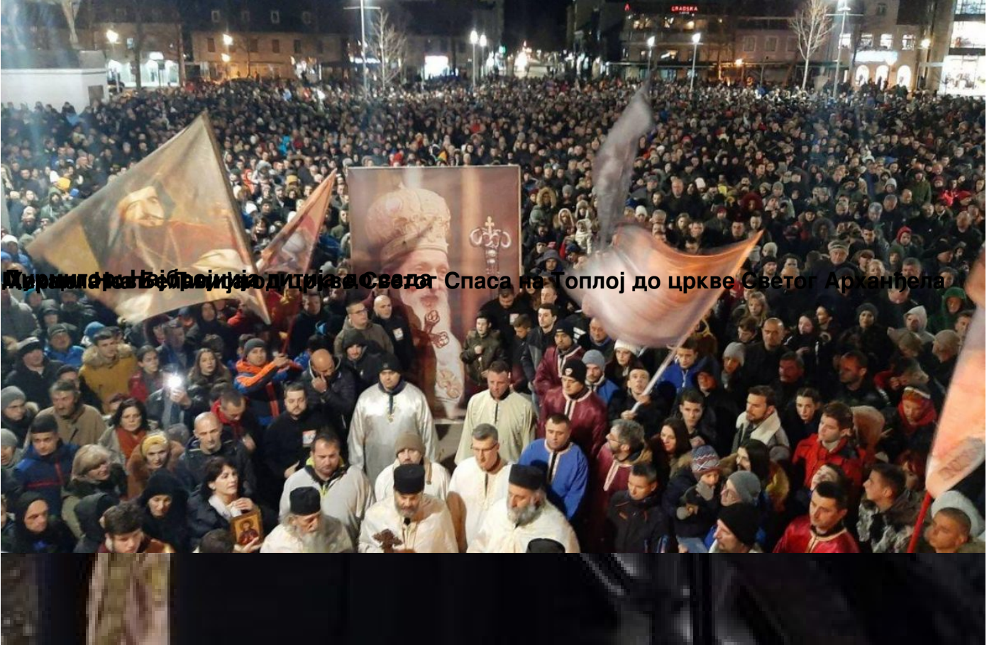
Директор Библиотеке и Центра за Света Спаса на Топлој до цркве Светог Арханђела