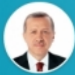
Recep Tayyip Erdoğan

● Leading Candidate of the Presidential Race