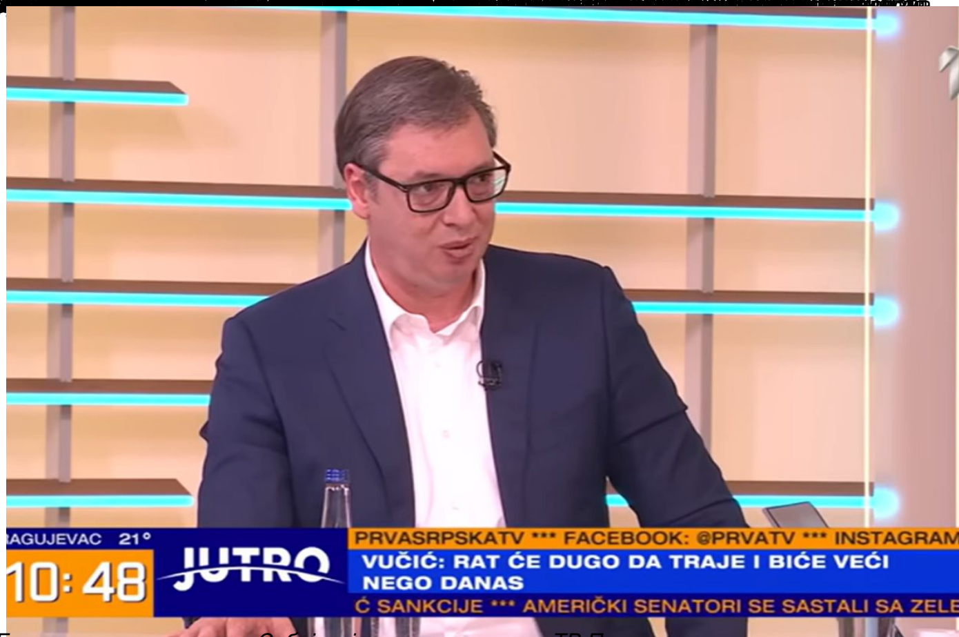
Гостовање председника Србије у јутарњем програму ТВ Прва