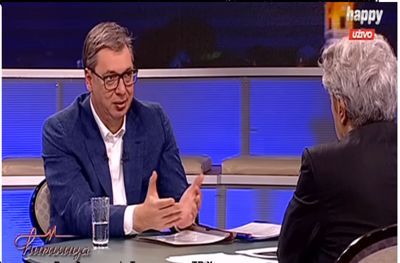
Александар Вучић у емисији Тирилица на ТВ Хепи