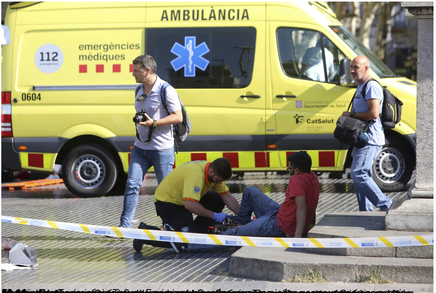
13 особа погинуло, а више од 100 повређено. Делатност се одвијала у пешачкој зони у Барселони.