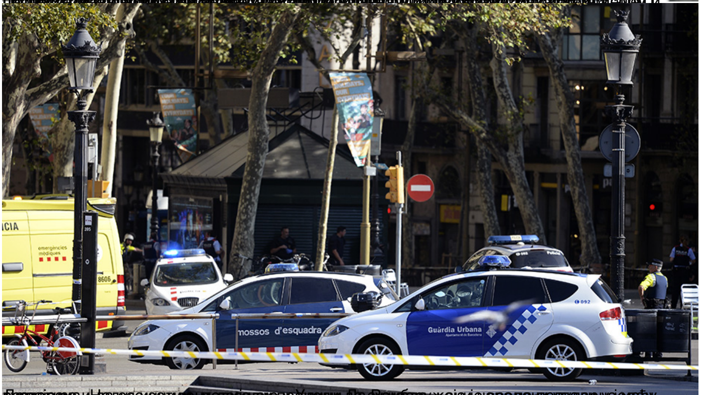
Датум: 17.08.2017. 20:20. Место: Барселона, Каталунја. Опис: Комби улетео међу пешаке у пешачкој зони, 13 особа погинуло, а више од 100 повређено.