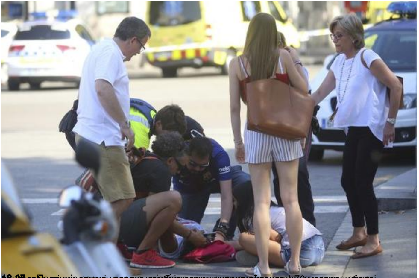
18.47 - Полицијер саопшти да стажије било пуношавем међу пешака и 70 ма сина у рбди