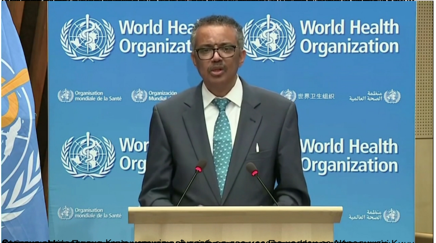
Виртуелна скупштина СЗО о одговору света на пандемију одржана је у понедељак у Кијеву