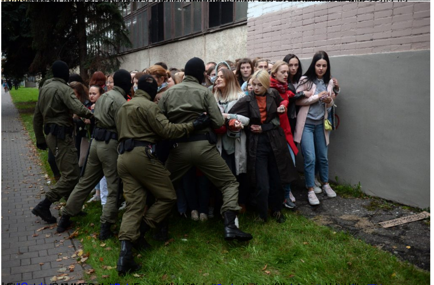
Добили смо имена оних који су тукли и мучили људе, састављамо листу поли четвртак, 17 септембар 2020 18:32