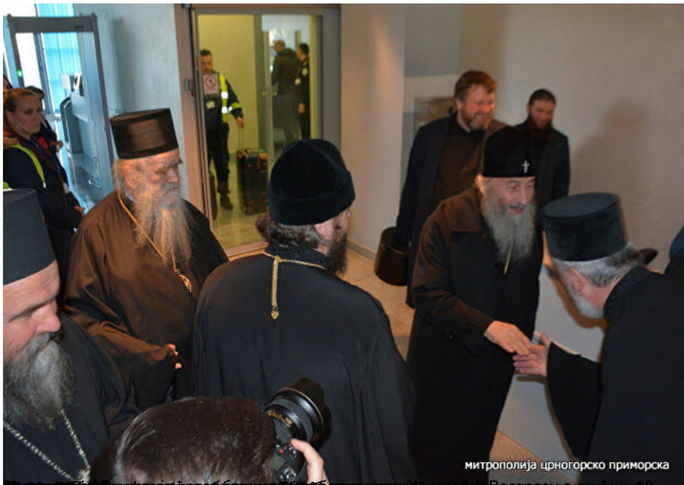
митрополија црногорско приморска

Митрополит Онуфрије са митрополитом приморско-црногорским уочи литије за одбрану светиња у Београду