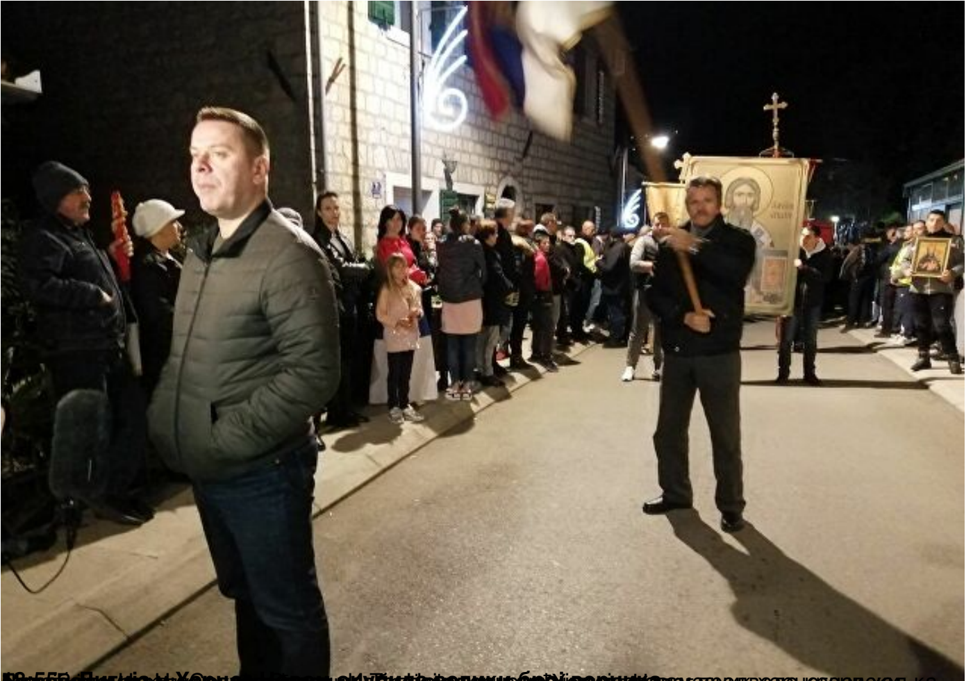
Митрополит Онуфрије са митрополитом Херцеговине и БиХ митрополитом Јеронимом у седишту Цркве у Сарајеву