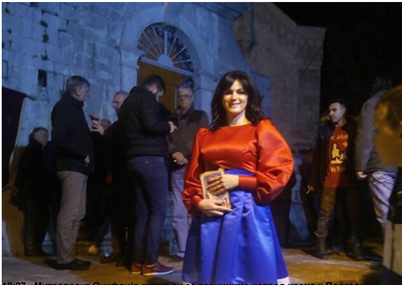
18:37 - Митрополит Онуфрије снимљен са верницима испред храма у Подгорици