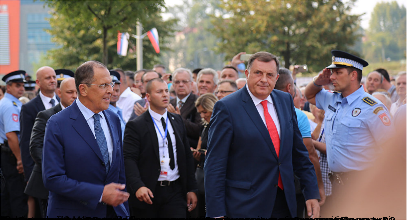
Београдски центар: Српски премијер и Лавров ојачају сарадњу РС и Русије