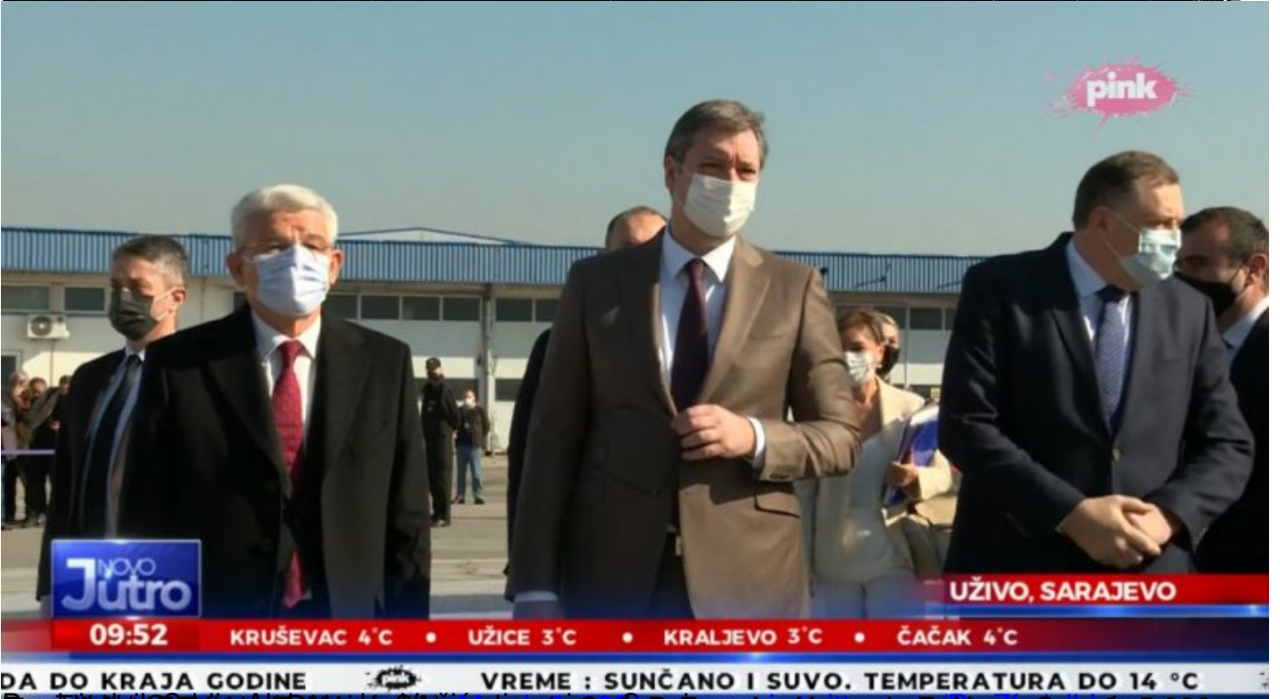
Pročelnik Srbije Aleksandar Vučić uručio je u Sarajevu Fondaciju Milica Čačak 5.000

View this post on Instagram Shared by Aleksandar Vučić (@aleksandarvucic)