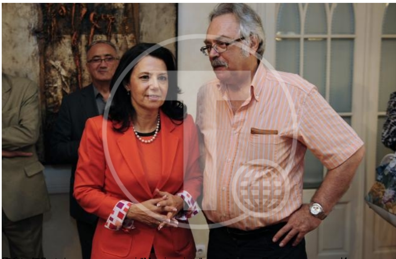
Билборд Београд, саопштење о раду и обележавању 24. годишнице од оснивања ДСС: ДСС је све време била, ос уторак, 26 јул 2016 22:25