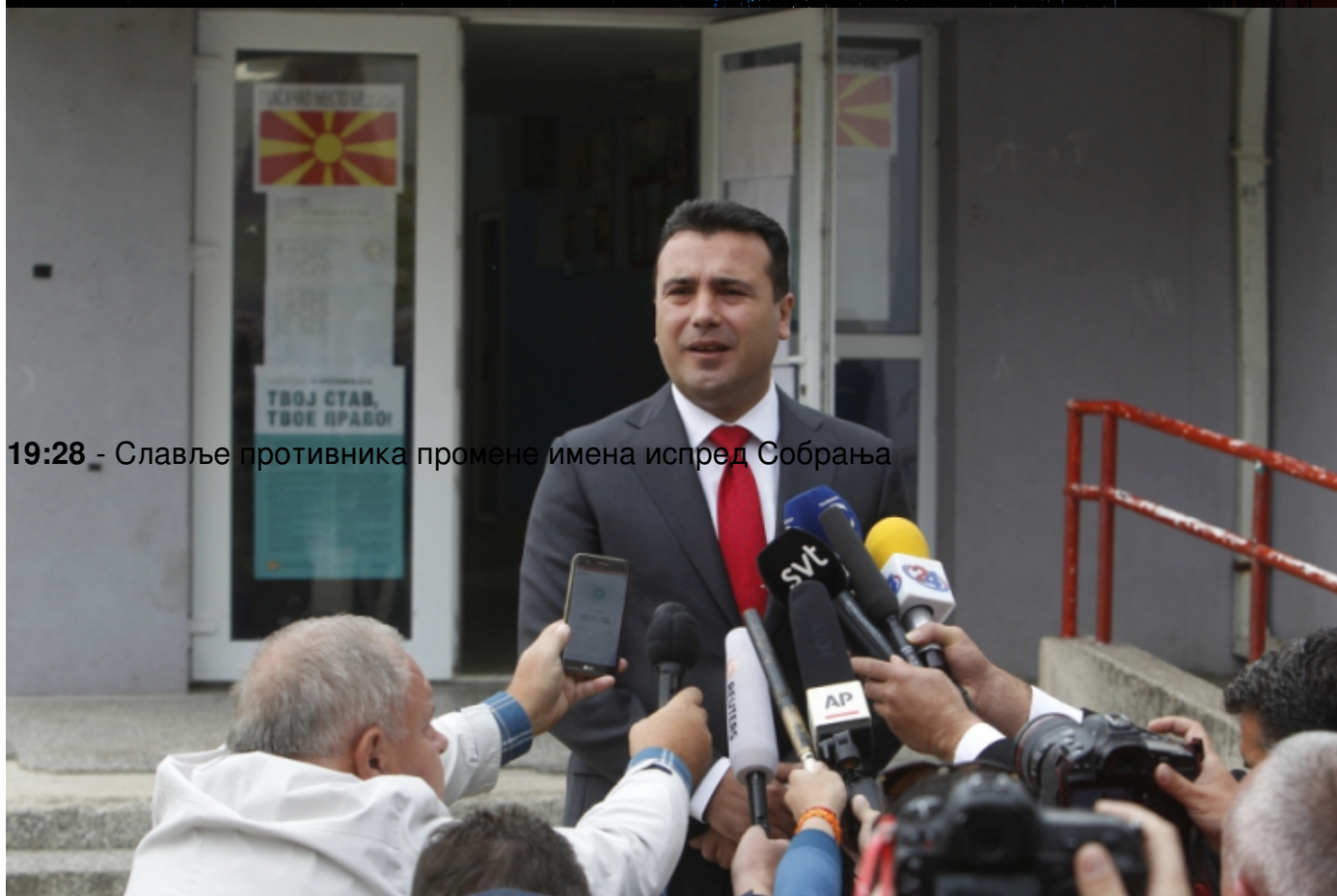
19:28 - Славље противника промене имена испред Собрања