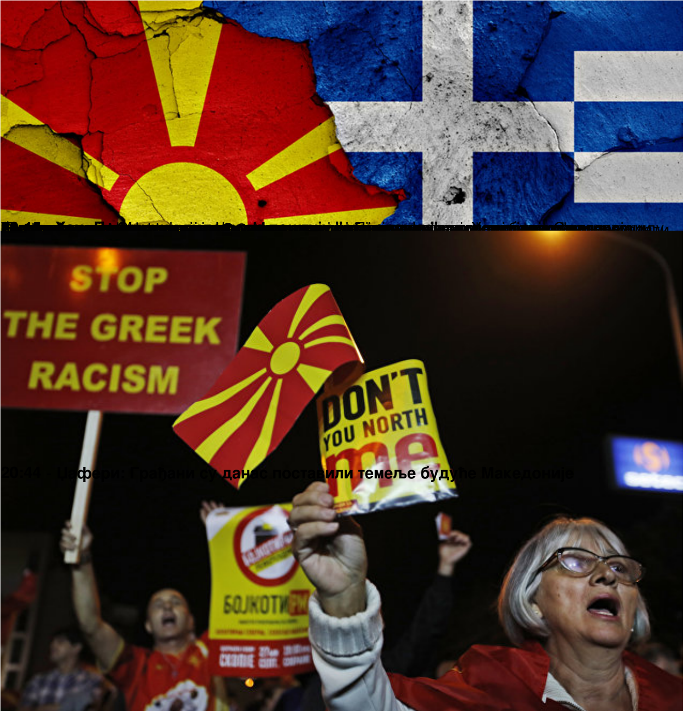
Граѓани су данас поставили темеље будуће Македоније