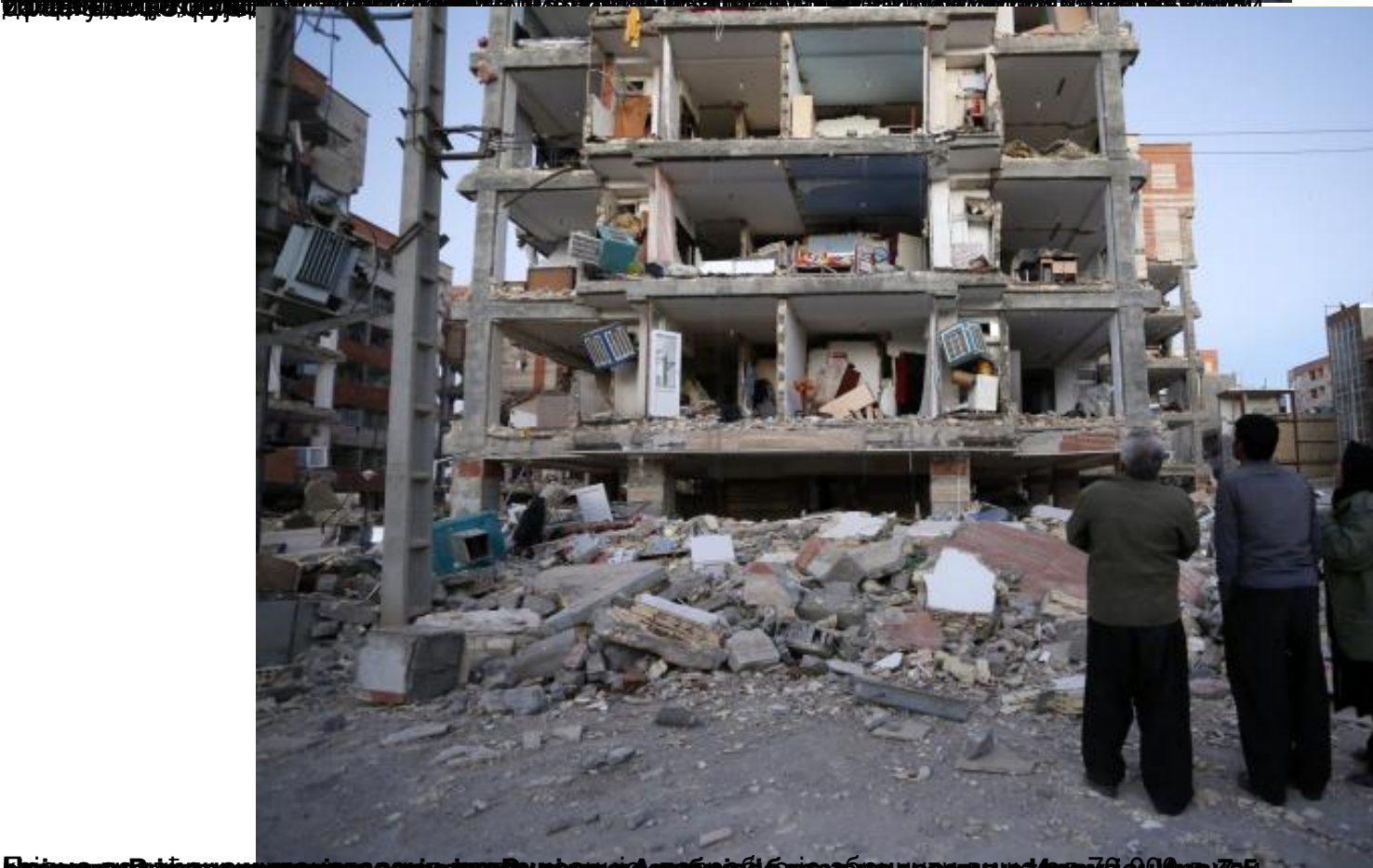
Билда из медија о земљотресу који је разорио градове на граници Ирана и Ирака