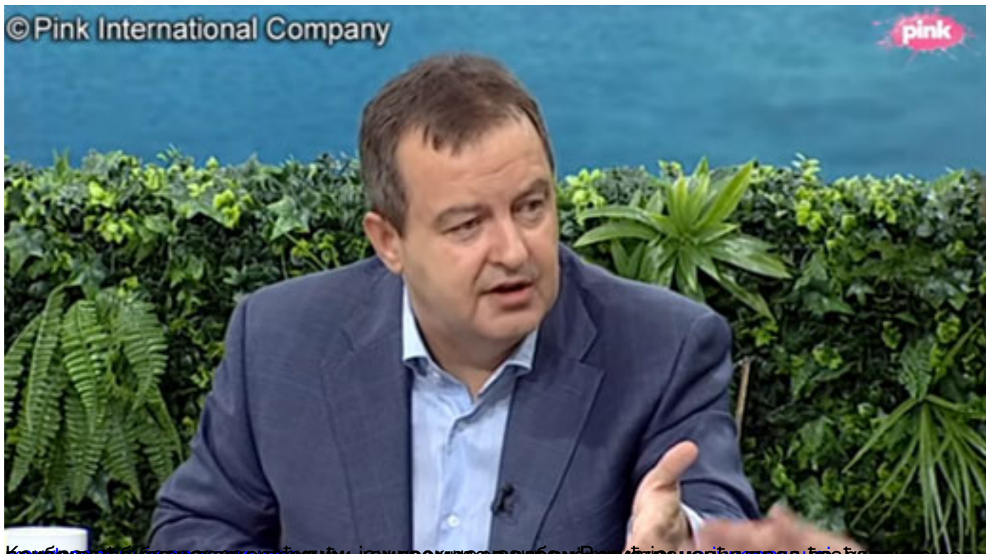
Косовски таблоиди не само да се противе, још и премисе да албанци имају право да се