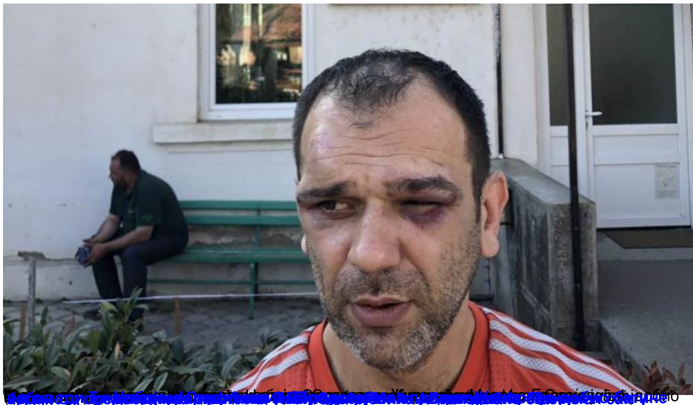
Албанац који је био жртва физичког обрачуна у кабинету председника општин