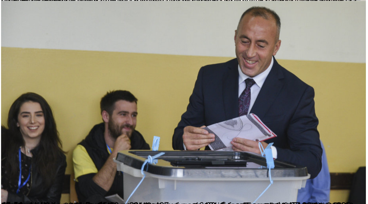
Ивица Дашић: Избори на "Косову" од виталног значаја за Србе