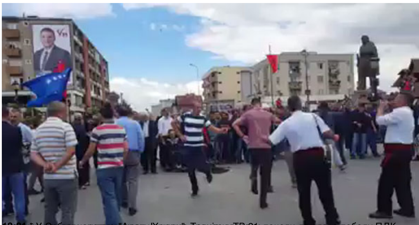
У Београду се одвијао концерт поводом победе ПДК на парламентарним изборима на "Косову".