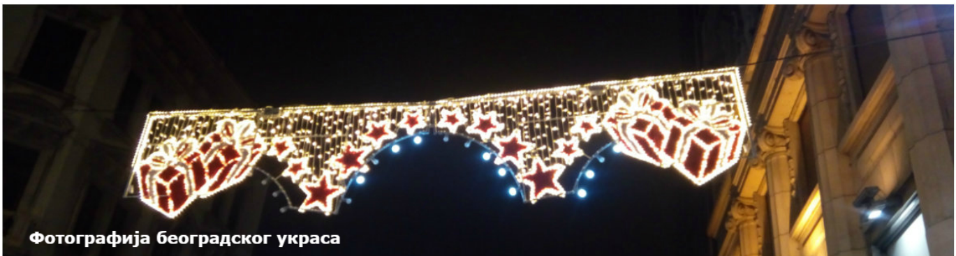
Фотографија београдског украса

© 2017 Kip Light. All rights reserved. This document is confidential and intended solely for the use of the individual user. It is not to be distributed, copied, or used for any other purpose without the express written consent of Kip Light.