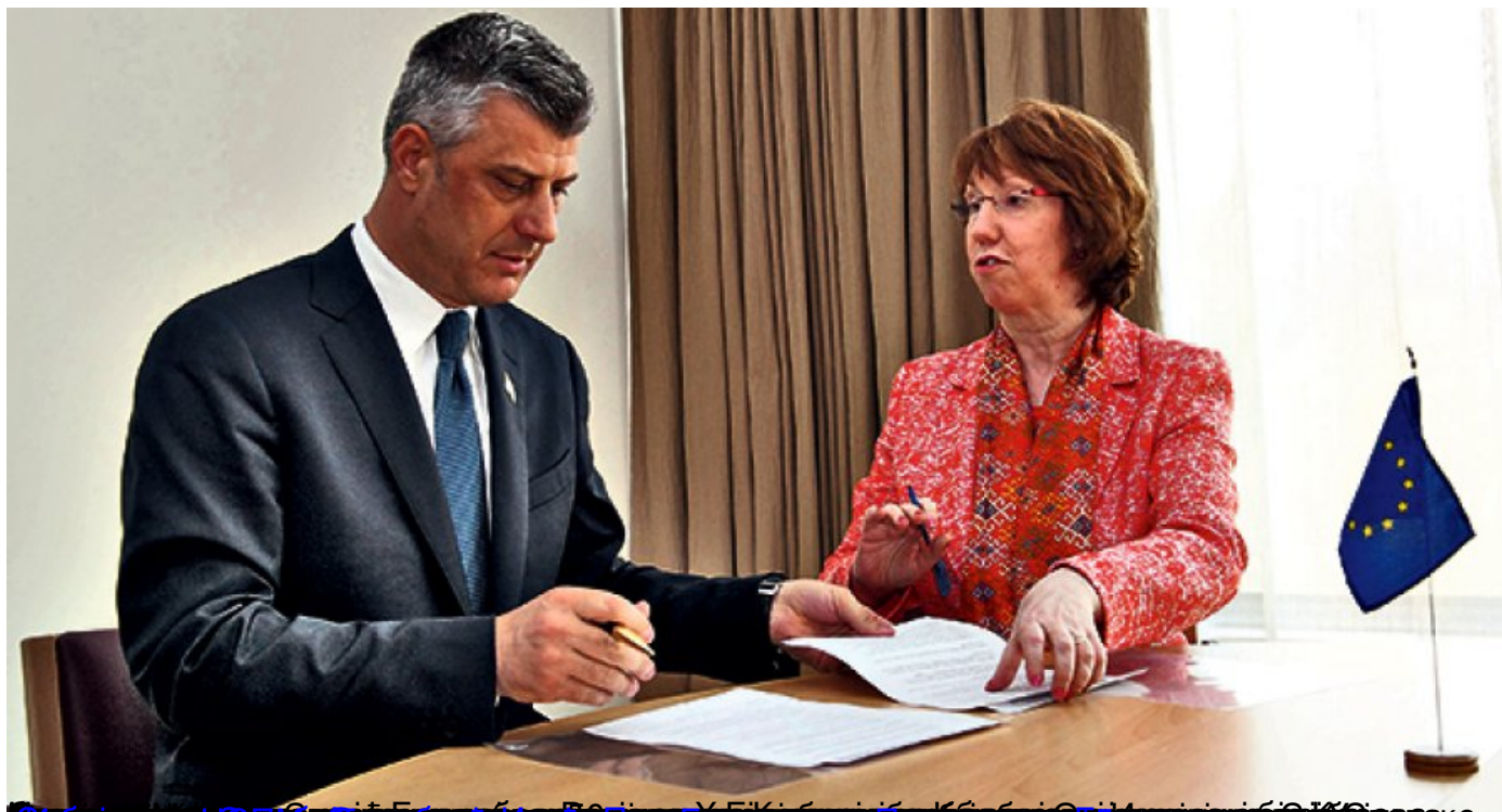
Српски државни секретар Ивица Дачић потписује Споразум о нормализацији односа са Боснијом и Херцеговином у Београду