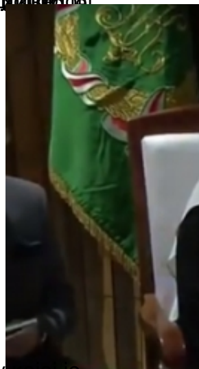
Својом се одређеном историјом, Међународна организација за правду и правду у којој је