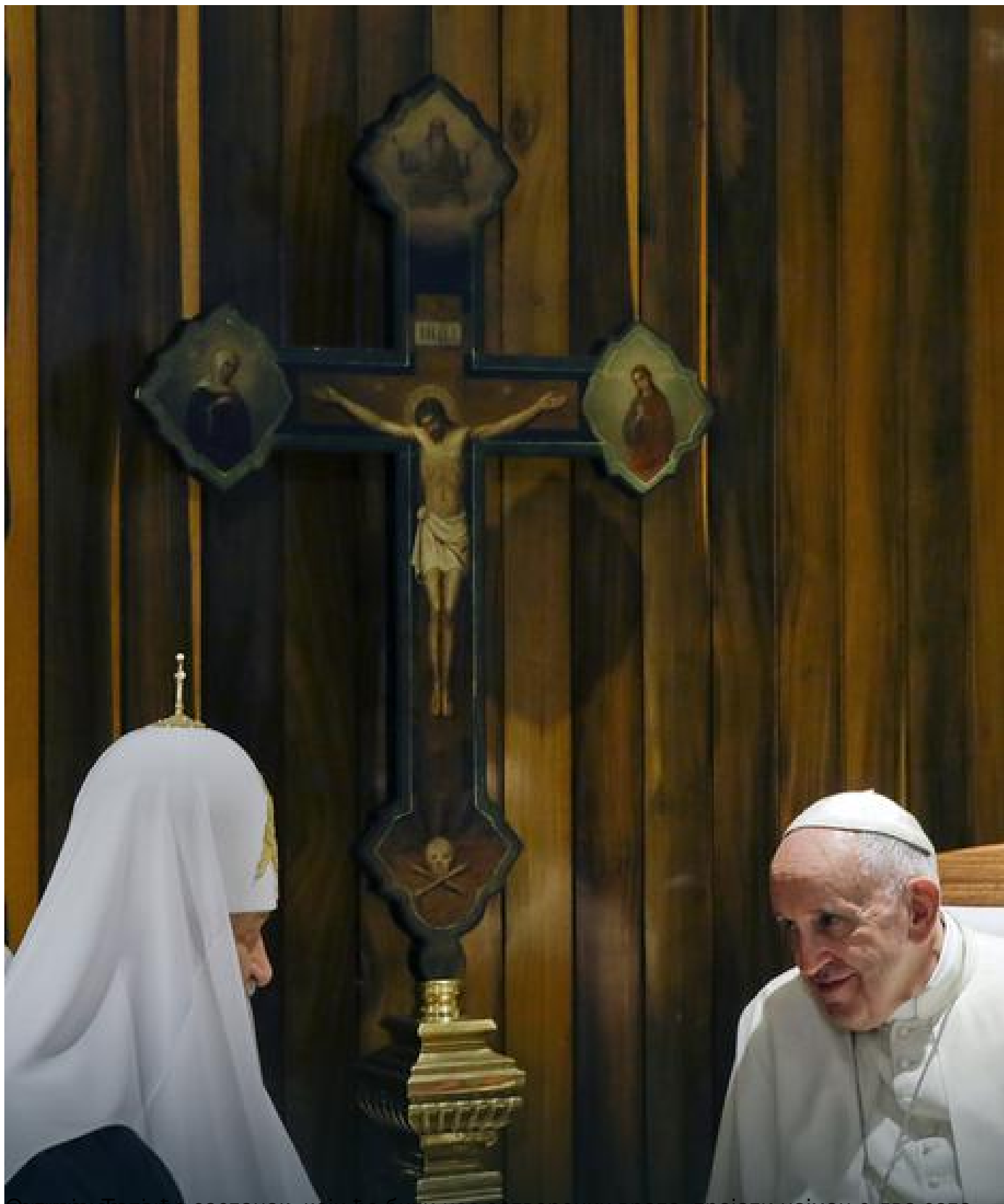
Франџе и Кирил ће састанак, који ће бити иза затворених врата, трајати најмање два сата,