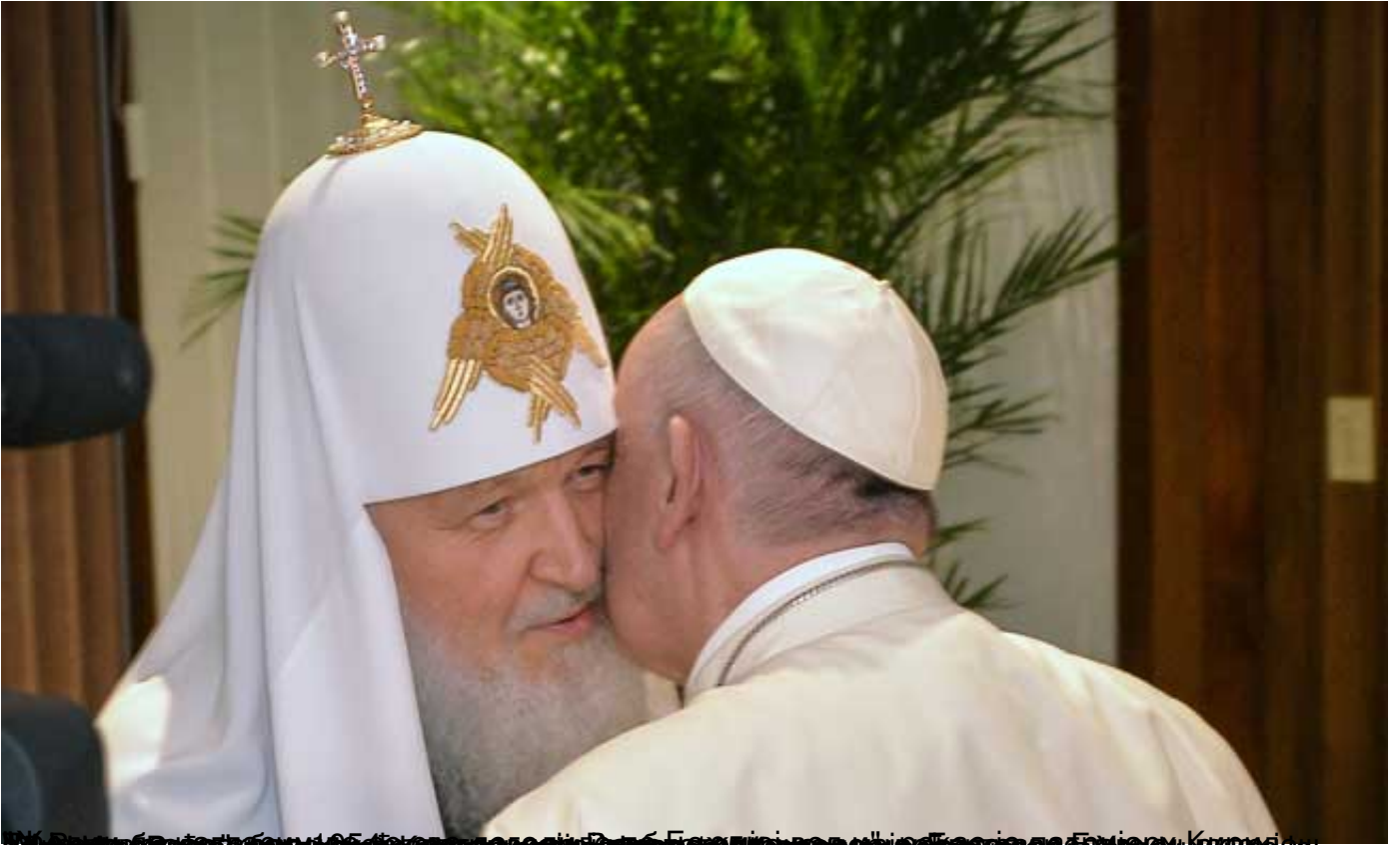
Папа Франциско и патријарх Кирил у Хавани, 12. фебруар 2016. (Слика: А. М. / А. М. / А. М.)