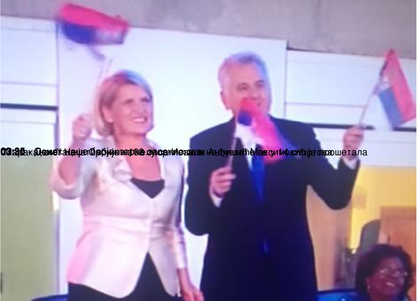
00:35 Делегација Бразила се састаје са председником Адуеларо Масулићем и његовом супругом