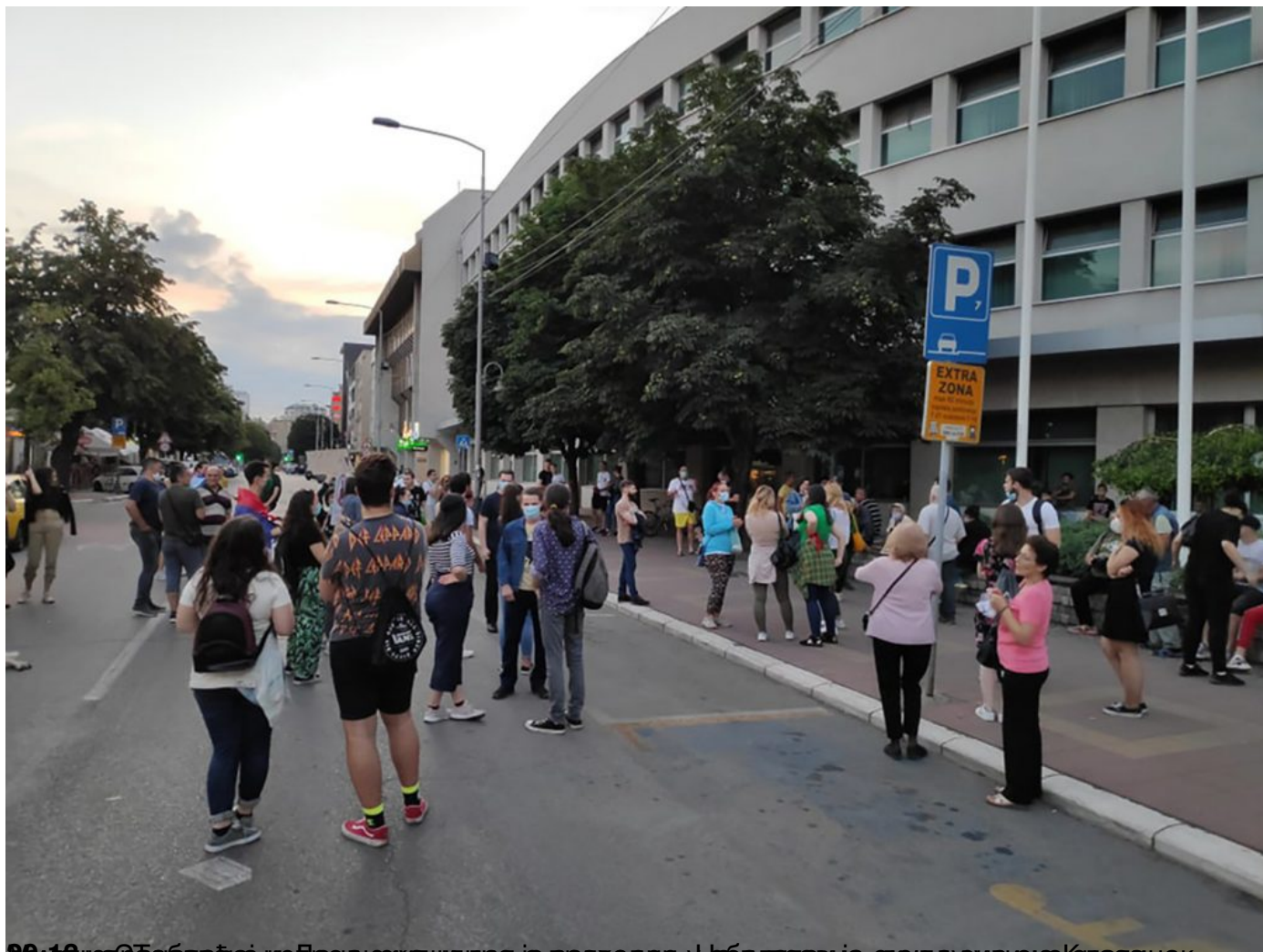
Демонстрација испред зграде Народне банке у Београду, док се у улици Кнезана