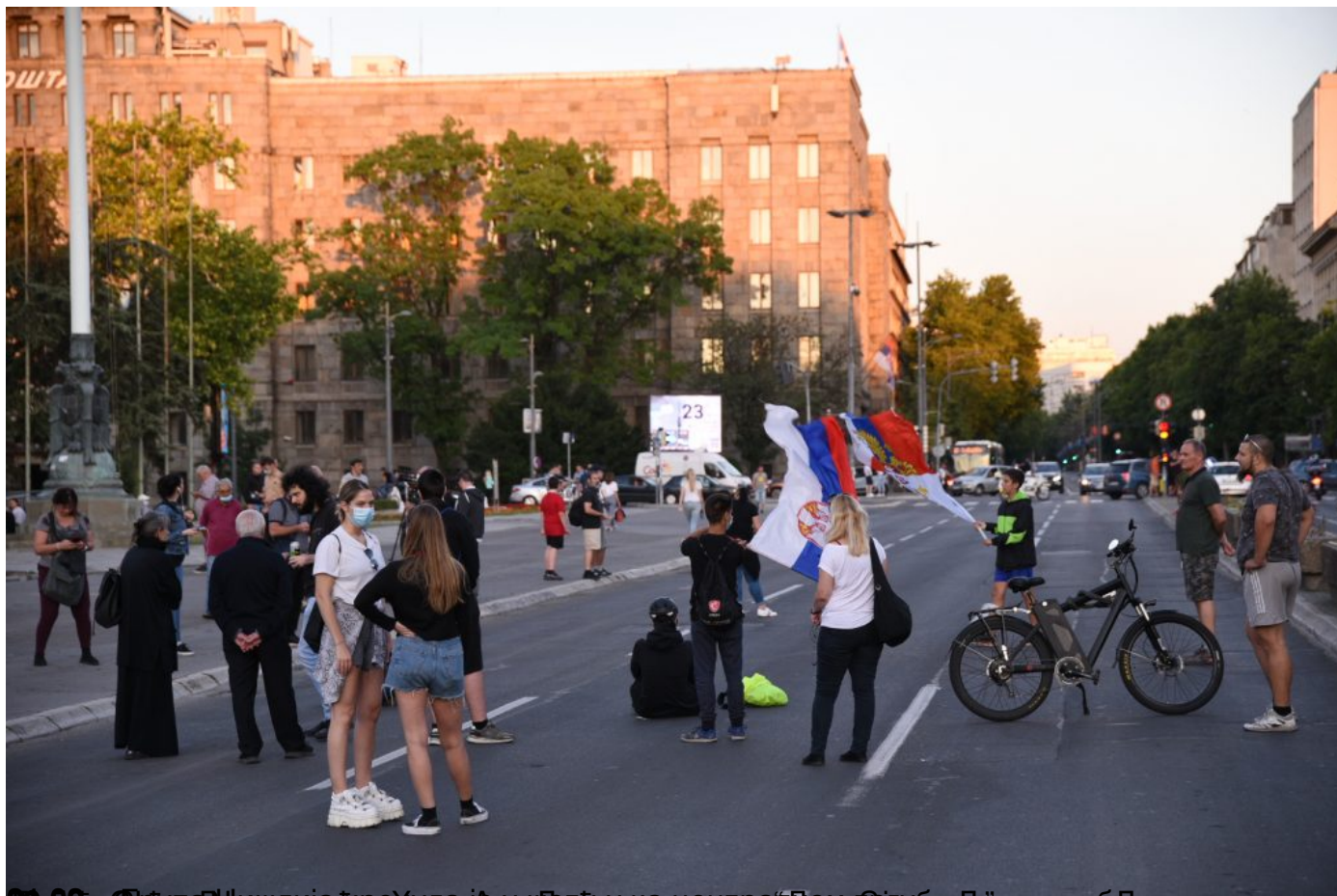
21.07.2020. Београд, улица Краљице Милице, протест у знак подршке Српској војсци и Српској православној Цркви.