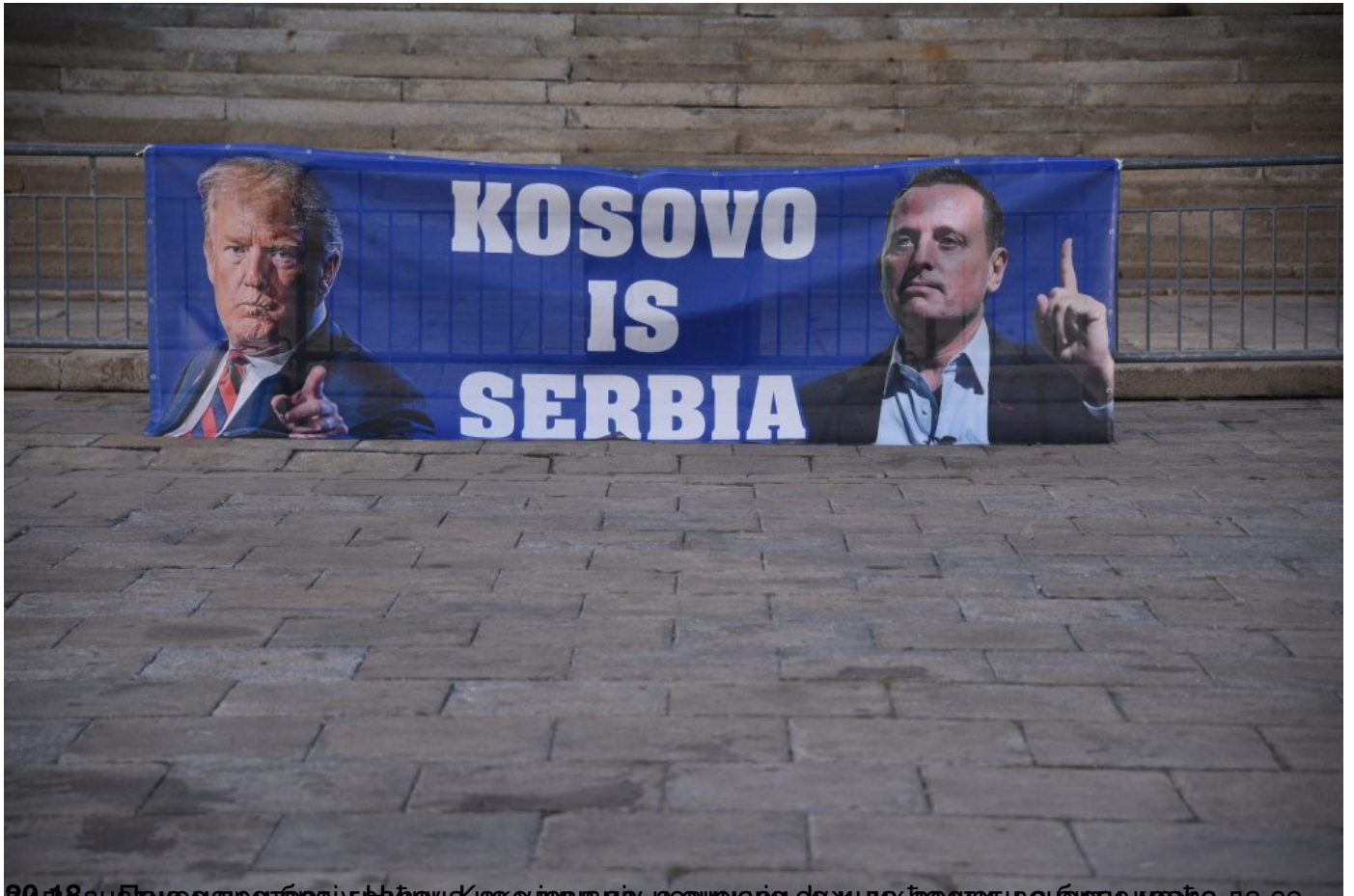
2018. Знајући мали број грађана у Београду, организатори су жиде да се неће одржати протест. Да се