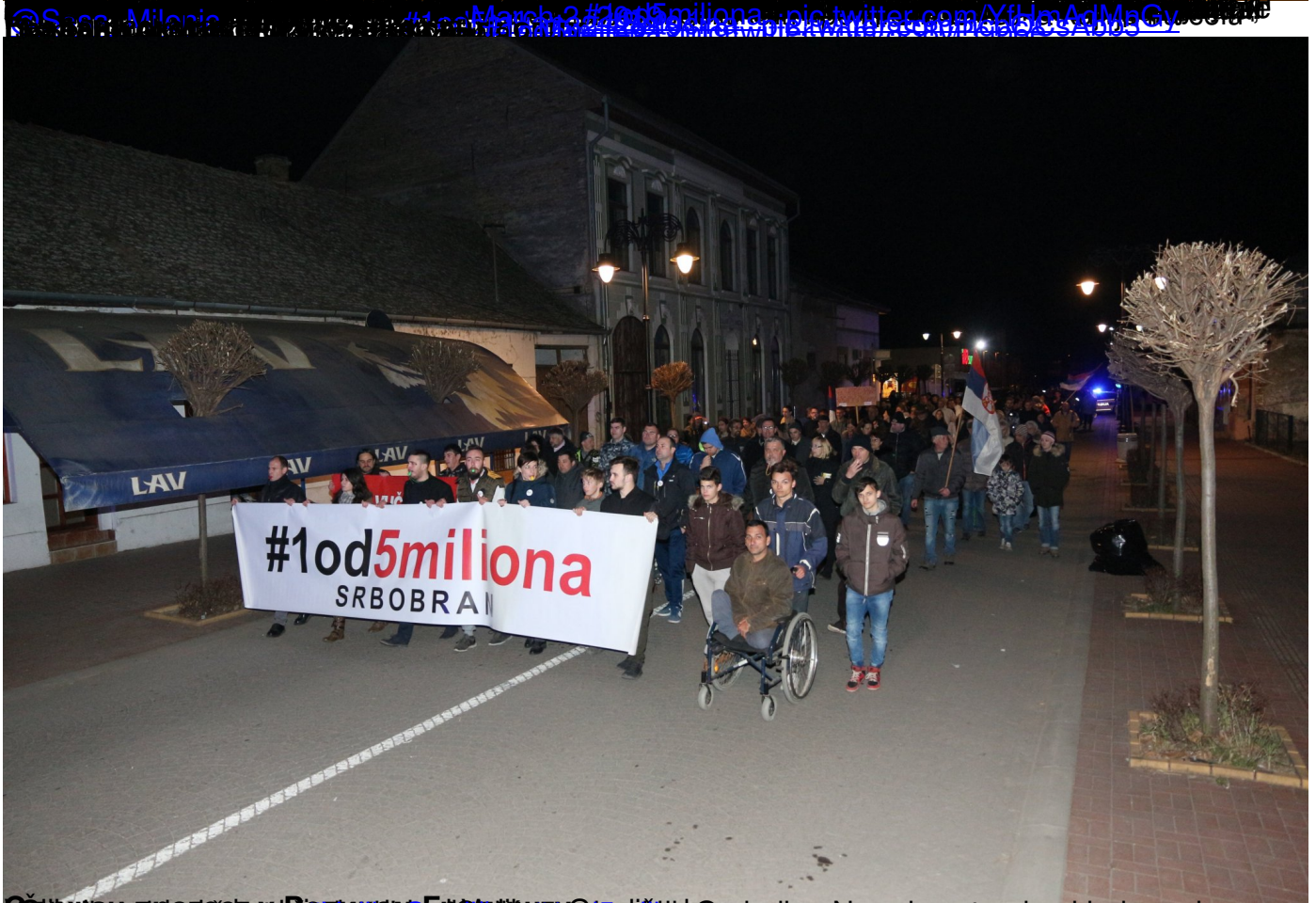
Одржани протести „1 од 5 милиона“ у Крагујевцу, Прокупљу, Ђуприји, Лебанама, Власотинцу, Алек субота, 02 март 2019 22:25