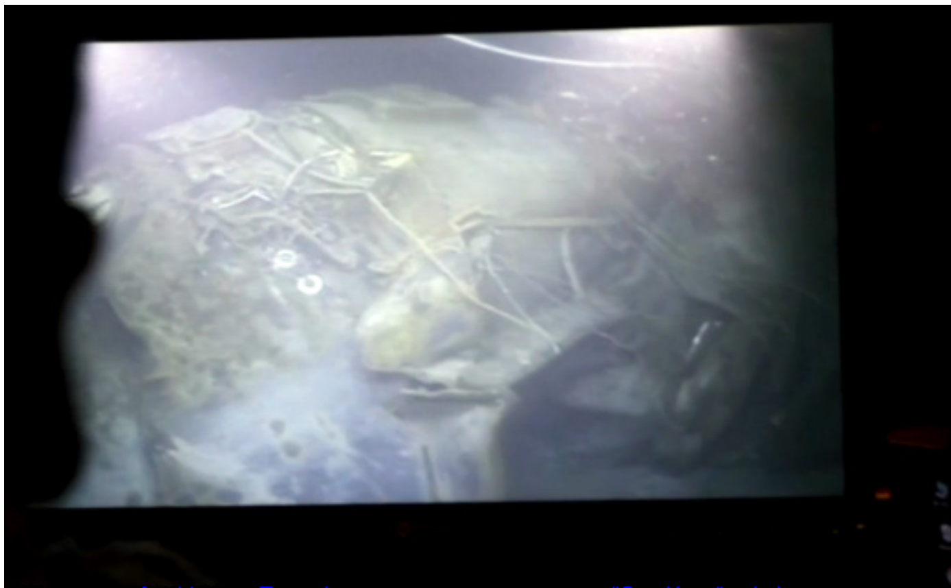
годину дана Аргентина Проведена потонуће подморнице „Сан Хуан“ која је мртва пре