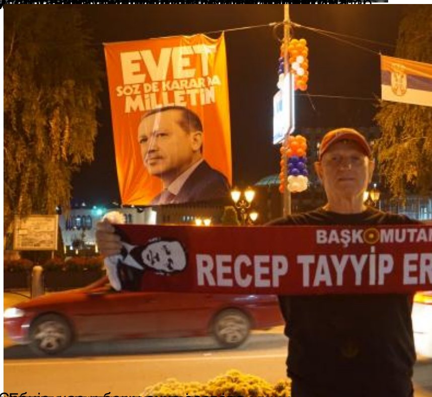
После долазак председника у српској и Турске, Србија, који би био настављајући велики