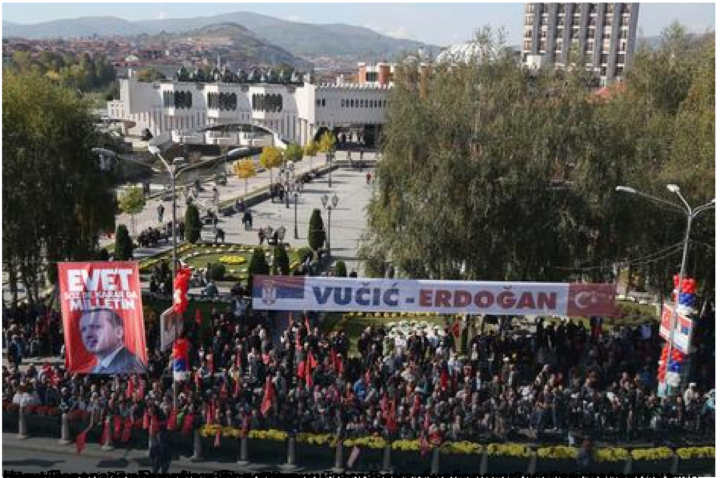
Републикански председник Србије и Турске у Новој Пазари