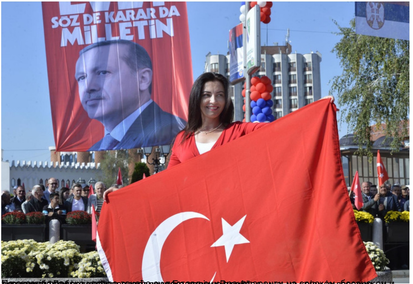
Председник Републике Србије и председник Турске долазе у Нови Пазар на српско-турском и