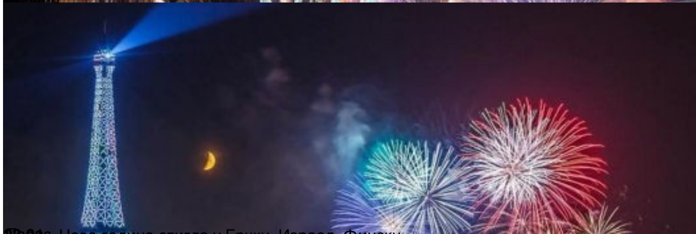
2013. Нова година стигла у Ерику, Израел, Финску