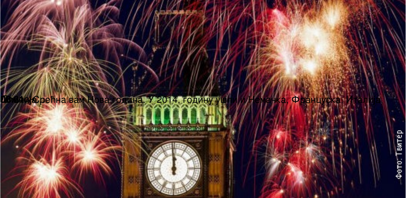
Лондон, Срећна вам Нова година. У 2014. годину ушли и Немачка, Француска, Италија.