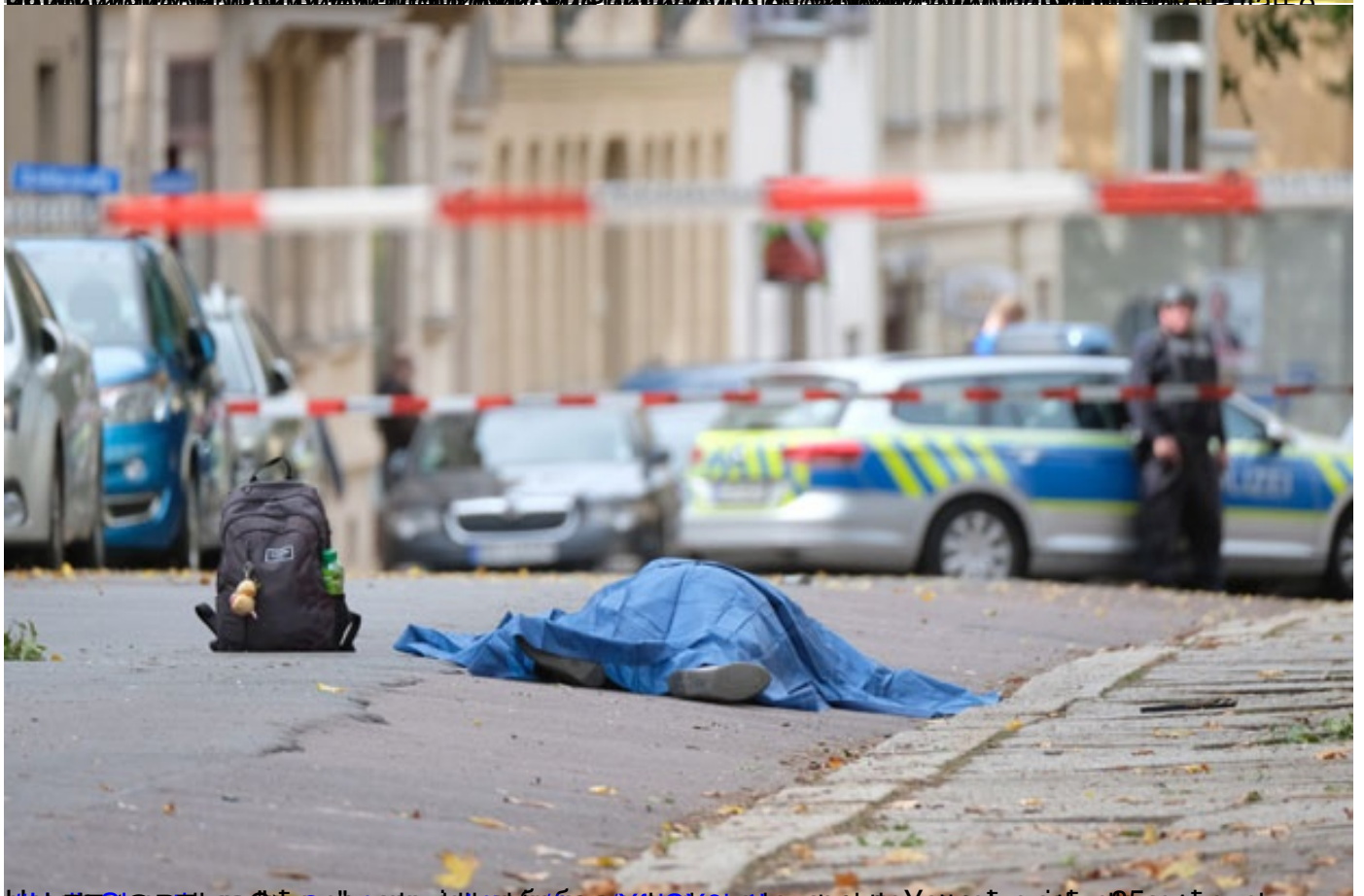
Неколико рањеника упуцаних у главу и у срце на улици у јужној Немачкој