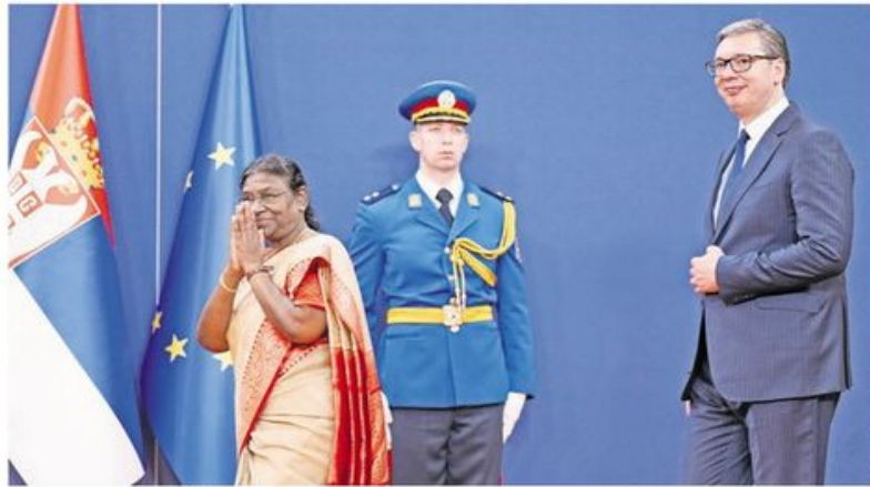
Лидери две државе јуче у Београду