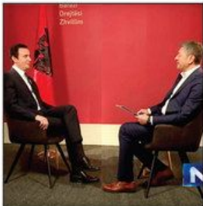
Intervju sa budućim premijerom Kosova Aljbinom Kurtijem „posejao“ letke mržnje