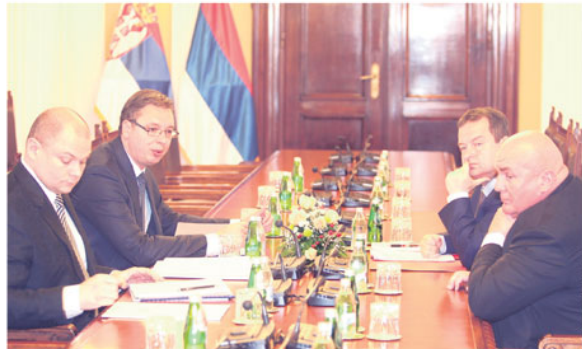
Лидери социјалиста и Јединствене Србије на консултацијама са мандатаром Александром Вучићем