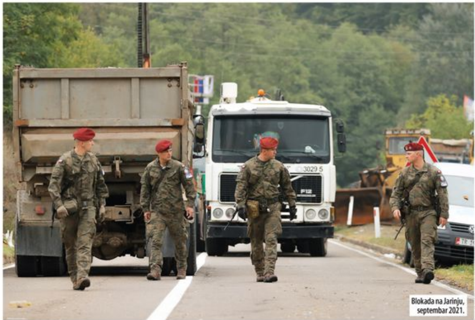
Blokada na Jarinju, septembar 2021.