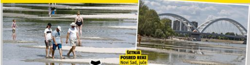
ŠETNJA POSRED REKE Novi Sad, juče

METEOROLOZI: VEĆE KIŠE NEĆE BITI DO OKTOBRA