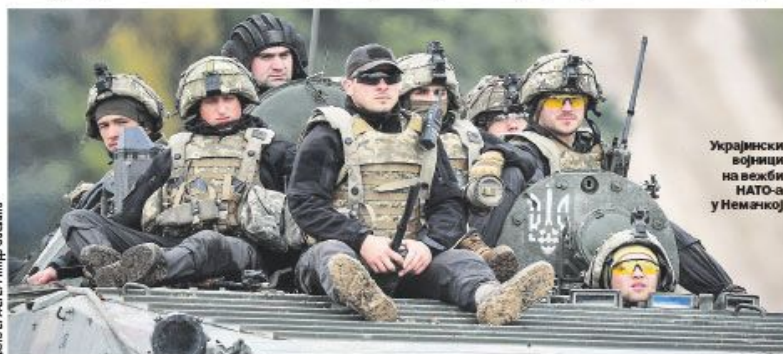
Украјински војници на вежби НАТО-а у Немачкој

Делегација Кијева не иде на преговоре у Минск, а Зеленски лобира за што хитнији пријем Украјине у алијансу