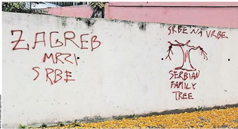
Графити мржње исписани у близини Основне школе „Савски гај“ у Загребу

Тешко је међу преосталим Србима у Хрватској наћи саговорника вољног да јавно говори о болној и још врло деликатној теми као што је „Олуја“, а та тишина и суздржаност и најбоље илуструју њихов положај