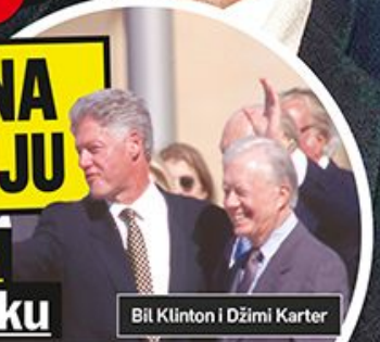
Bil Klinton i Džimi Karter