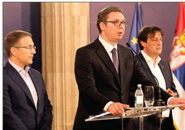
Od njihovih odluka sve zavisi: Nebojša Stefanović, Aleksandar Vučić i Bratislav Gašić