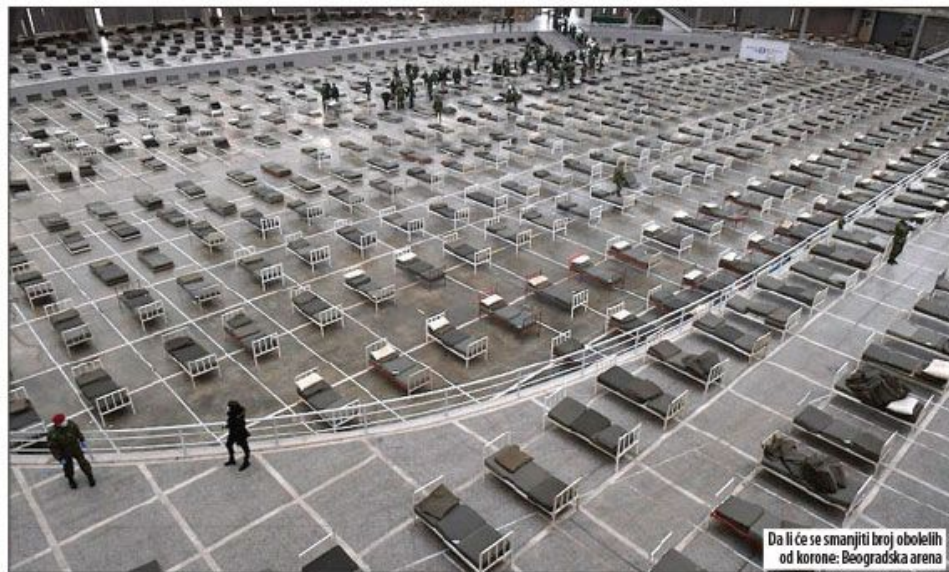
Da li će se smanjiti broj obolelih od korone: Beogradska arena